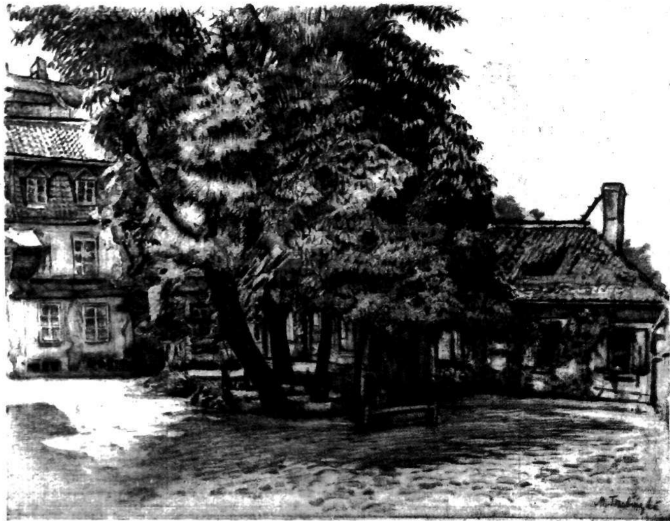
Podwórze p.p. Kanoniczek na pl. Teatralnym