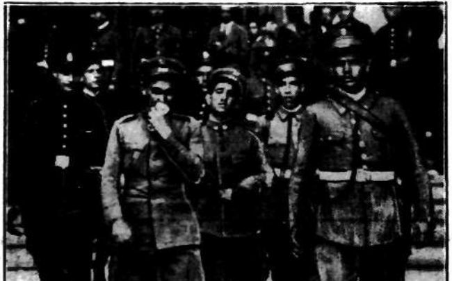
Zołnierze oddziałów armji hiszpańskiej; którzy brali udział w monarchistycznym zamachu stanu w Hiszpanii, odprawiani na rozbrojenie na odwach przez gwardzistów republikańskich.