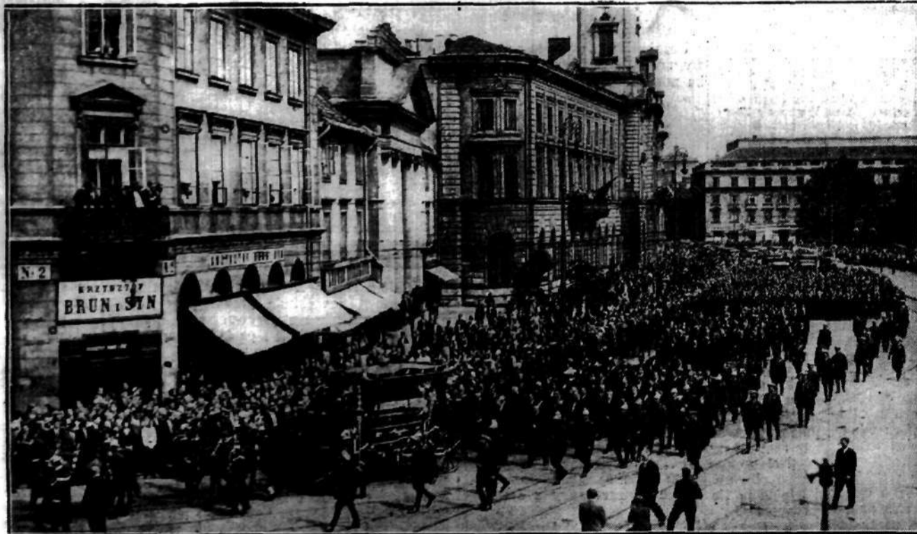
Kondukt pogrzebowy na pl. Teatralnym.