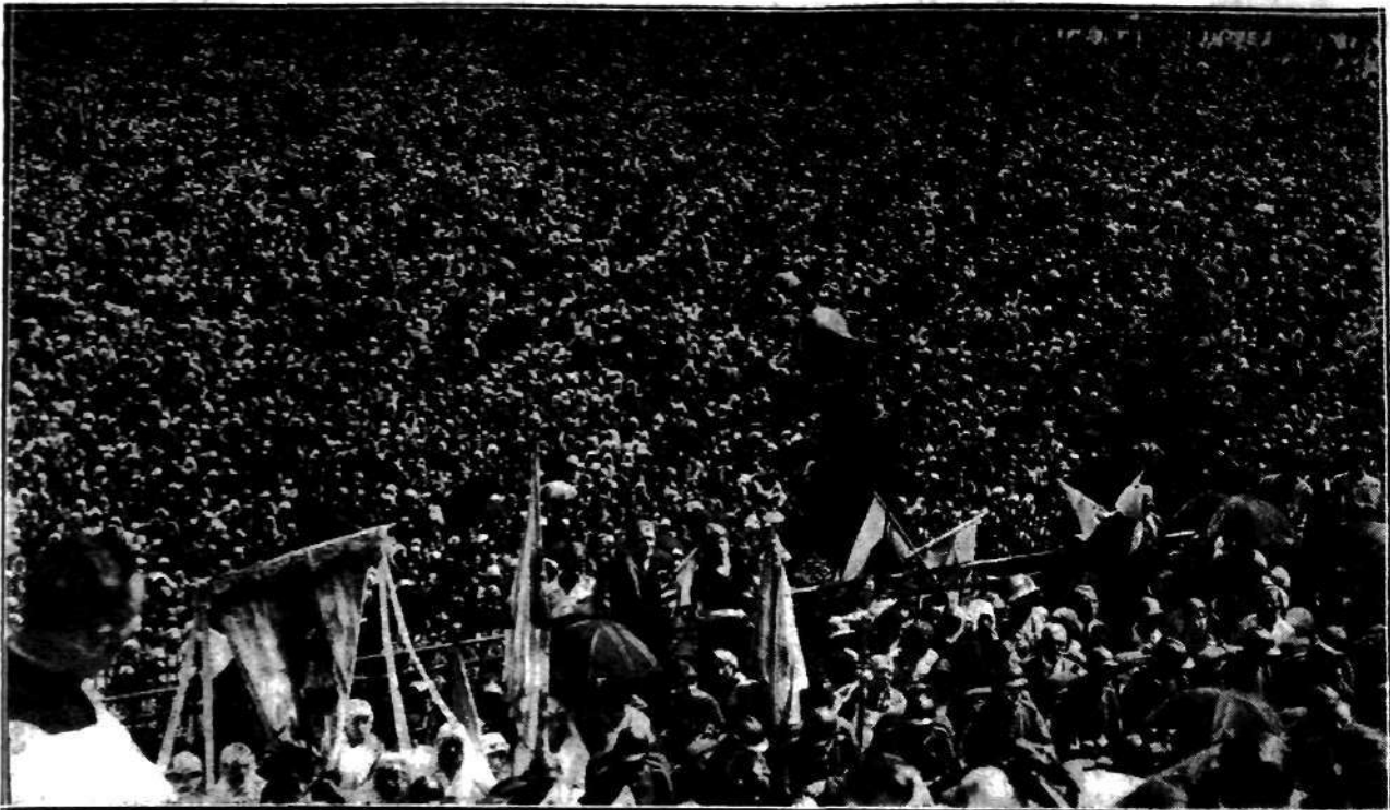
Obrzymie tłumy pielgrzymów pod klasztorem jasnogórskim, które przybyły do Częstochowy na uroczystości jubileuszowe, widziane ze szczytu wzgórza klasztornego.