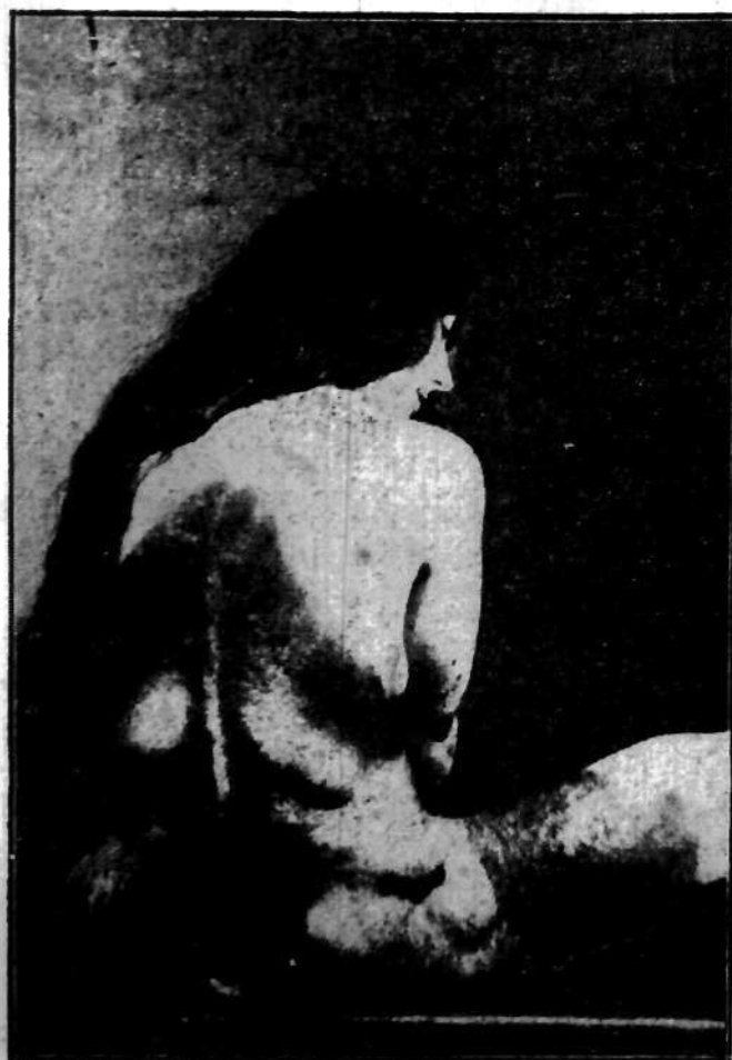
Uczony holenderski Bérnalof Moens odnalazł w Nici na Riwierze francuskiej młodą dziewczynę, której ciało od piersi do kolan obrośnięte jest gęstym włosiem jak u małpy.