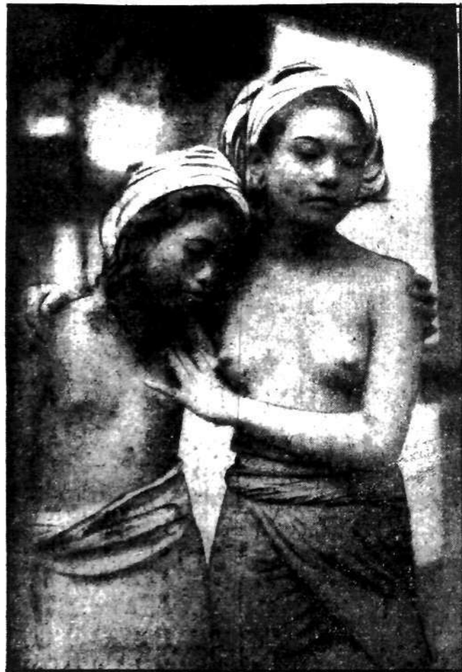
Dwie małe piękności z czarownej wyspy Bali wywierają na nas pełne smutnego uroku wrażenie