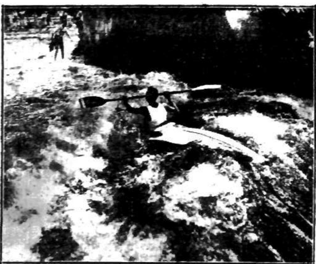
Sezon wioślarski w pełni. Kajakowcy wyzyskują każdy pogodny dzień, aby używać ulubionego sportu. Oto popis jednego z mistrzów kajaka przepływającego odważnie przez porohy Izary