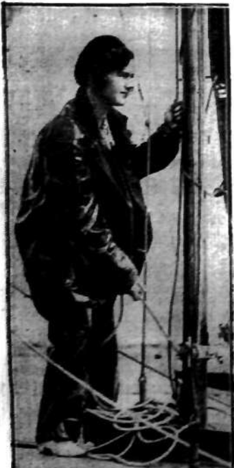
Wiosenny sezon regat rzecznych w Anglii już rozpoczął.