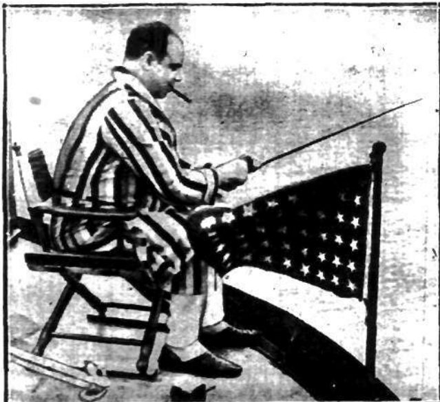
Słynny przemysłnik alkoholu Al Capone, odsiadujący obecnie karę więzienia, z którym ma zamiar porozumieć się płk. Lindbergh w celu odzyskania dzieci. Na zdjęciu Al Capone łowiący beztrósko ryby podczas wywczasów na Florydzie przed uwięzieniem go przez władze amerykańskie.