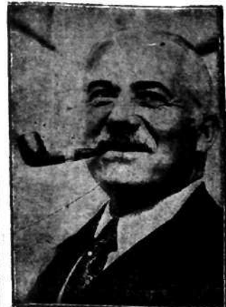
sir Henry Deterding, przekupujący we dług pogłosek nawet królów, znalazł się w trudnościach finansowych z powodu nagłej i masowej podaży akcji trustu naftowego Shell Royal Dutch, którego jest właścicielem.