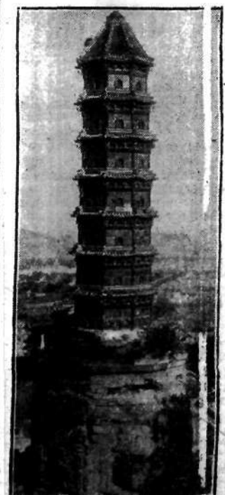
Coraz mniej już w Chinach tych wspaniałych zabytków starych cesarskich Chin. Oto jedna z ostatnich pagód w okolicach Pekinu.