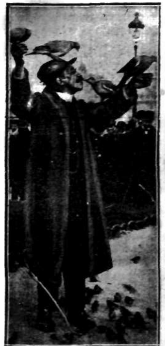
Znają go dobrze gołębie, gdyż codziennie przychodzi w to samo miejsce z zapasem pożywienia. Radość powitania jest wielka.

Obaj zostali wydobyty z kościoła przez syna organisty, który wyniósł ich z narażeniem własnego życia, niemal w ostatniej chwili przed zawaleniem się dachu.