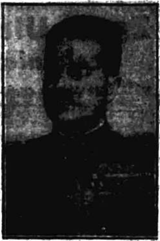
Nowy attache wojskowy przy poselstwie włoskim w Warszawie, mjr. Paesicci Dante.