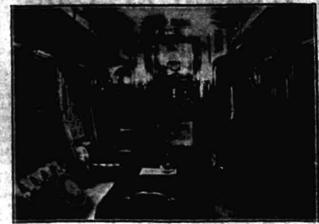
Wnętrze wagonu salonowego, którym Marszałek Piłsudski wyjechał na Madagę.