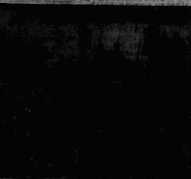
W drodze z kościoła na cmentarz