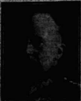
poseł p. k. Adam Koc