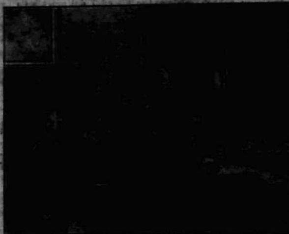
Weteran 63 r. i młodzień z zakładów nastkowych „Rodziny Wolskiej” wplacają swe życzenia do specjalnej księgi „wyłoboski” w Bełwederze.