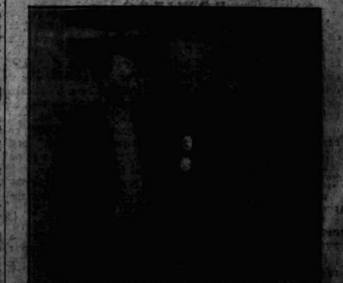
Zdjęcie telegraficzne chwili składania życzeń przez króla szwedzkiego. W tle widać znakomitych pisarzy amerykańskich: Sinclaira Lewisa.