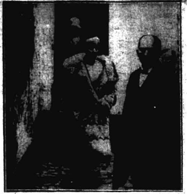
Królowa belgijska Elżbieta odwiedza w miasteczku Fiemale rodzinny ofiar tajemniczej mgły trujące. Serdeczne stosunki między Koroną a obywatelami w żadnym może kraju nie są bowiem tak żywe, jak w Belgii. Królową Elżbietę cały naród kocha za jej samarytaństwo, którego bohaterskie dowody dała w czasie wojny.