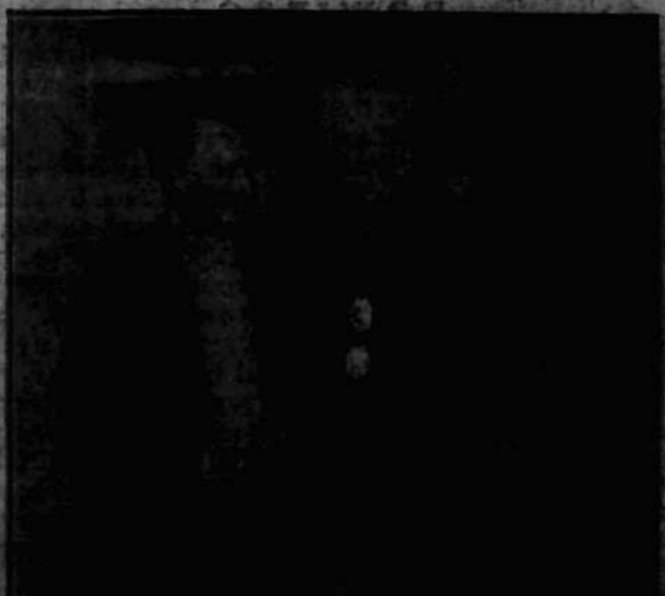
Zdjęcie telegraficzne chwili składania życzeń przez króla szwedzkiego, królową i członków pisarstwa szwedzkiego i szwedzkiego Senatu