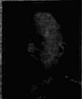
poseł pła. Adam Koc