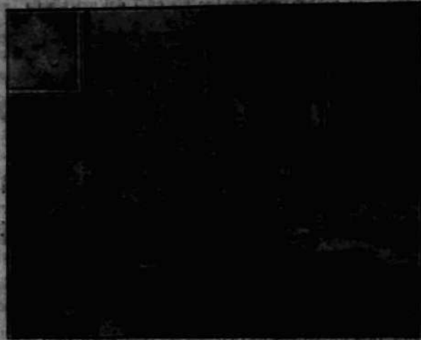
Weterani 63 r. i młodzież z zakładów nastkowych „Rodziny Wojskowej” wplisują swe życzenia do specjalnej księgi „Wielkonoj” w Belwederze.