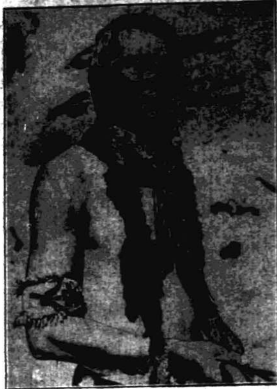
Typowy Czarnostopczy, jeden z ostatnich Indian plemienia „Czarnostopych” — „Ryk Burzy”.