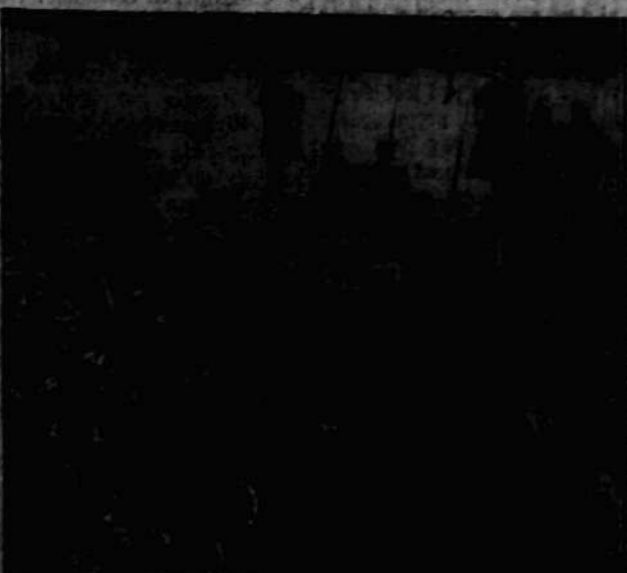
W drodze z kościoła na cmentarz