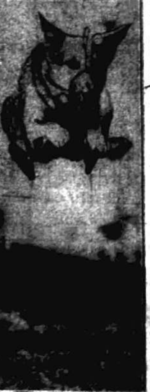
Mistrzowska skok budyńskiego pas polskiego „Jarka” przez przeszkodę w wysokości 2 mtr. 10-cm.