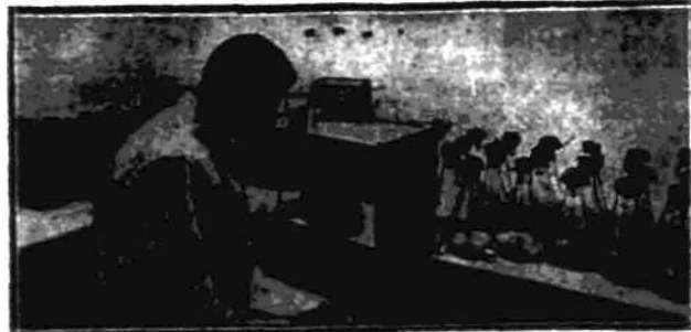
Sianko storczyków w specjalnych lankach białych na jałowym rozczynale agar-agaru.

Nasiona storczyków należą, jak wiadomo do najcięższych z pośród wszystkich nasion roślinnych: tyśiące ich idą na jeden gram. Wyni-