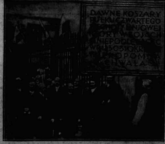
skłonięta na gmachu dawnych koszar 4 pułku piechoty liniowej przy ul. Krakowskiej w Warszawie w ramach obchodu rocznicy listopadowej. Na głazie z napisem inż. Słomiński, xx) szef kancelarji wojskowej ofik. Glogowski.