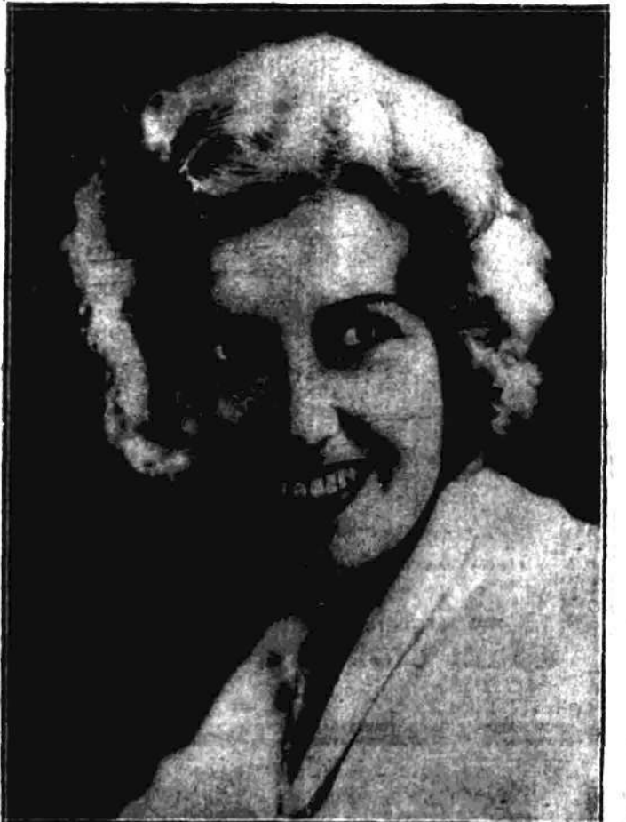
Włocza Blondynka, która wyznawca białki odrodziła czarwa Anonima.