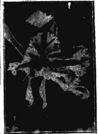
Kwiat storczyka Brasso-Cattleya-Violeta.

na roślinie z tyśiąca nasion. Mimo to kultura storczyków wymaga jeszcze wielkiego nakładu. Trzeba im odpowiedniego ciepła, wilgoci, powietrza. Przy największych zabiegach, trwających cały rok, tylko raz do roku zakwitają tajemniczy i piękny kwiat storczyka, którego znamy już dziesiątki tyśiące fantastycznych wprost odmian, przyczem niektóre odmiany dochodzą do dziesiątków tyśiący.