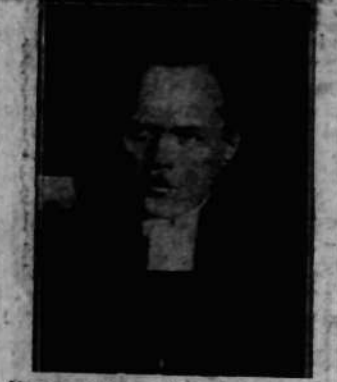
Nagroda Nobla za działalność na rzecz pokoju podziękowana została w tym roku pomiędzy Kellou'em a, arcybiskupem Szwajcarii L. Loederthumem.