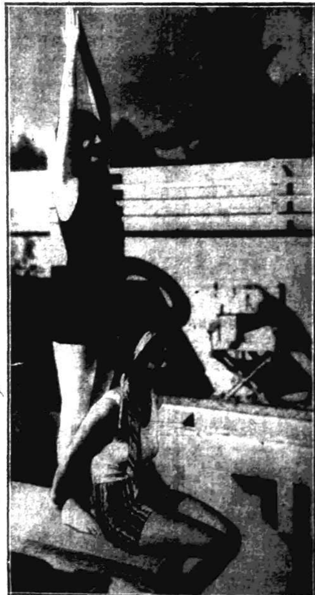
97 Kształtów 9 10; pozycje panuje upalne lato. Piękne AMERYKAŃSKI PIKNIK i KAR... DIA NA KRAJOWE.

Inspokcja śmigła samolotu pasażerskie-pomocy reflektorów elektrycznych o go, dokonywana w ciomnej hall przy przerywaniem światła.