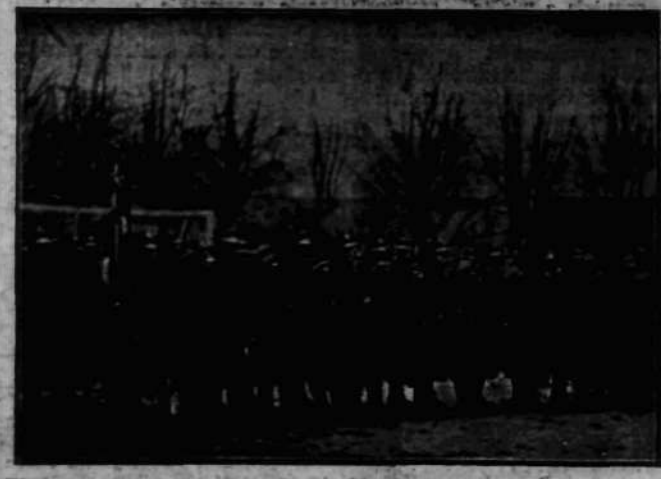
W centrum wydzielenia sanitarnego w Warszawie odbyło się wczoraj uroczyste zaprzysiężenie ochotników. Na zdjęciu kampanja na obrzeżach przysiężnicy.

zgrupowanych szwadronów i związków ze sztandarami i publicznością. Ceremonie rozpoczęła msza św. odprawiona przez księdza biskupa. Szereg Sowińskiego