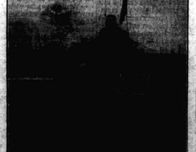
Demokratyczny napis na gmachu uniwersytetu w Madrycie w dniu polskiego strajku powszechnego.