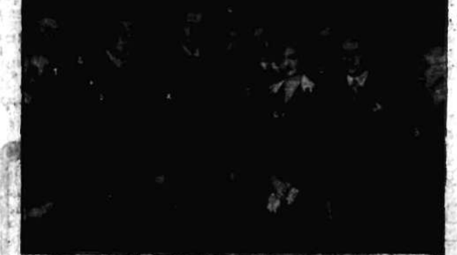
Na polskim obrazie dźwiękowym: (x) pan Prezydent, 1) wojewoda Jaroszewicz, 2) p. Głogowski, 3) Adam Brodzisz, 4) Bodo, 5) kompozytor Wars, 6) Jadwiga Smosarska, 7) mistrz Frenkiel, 8) Henryk Szaro, 9) Wacław Sieroszewski.