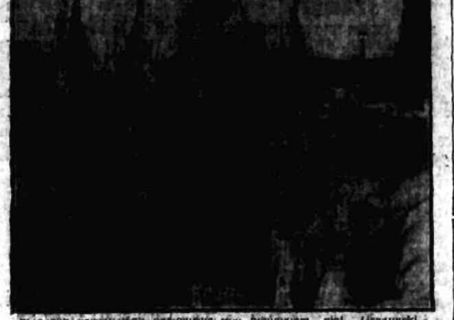
W cawin uroczystego odsłonięcia Pomnika woj. Uraszyński.