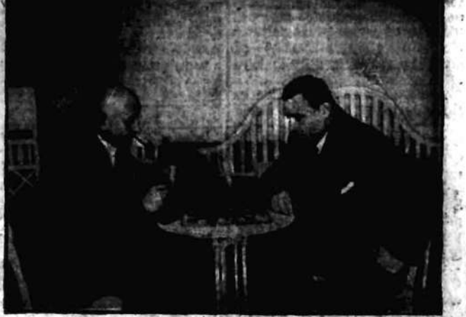
w towarzystwie z mławian w Poznaniu, gdzie odwi znakomity zapasnik polski