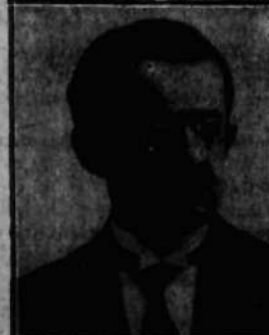
Dr. Leon Kozłowski