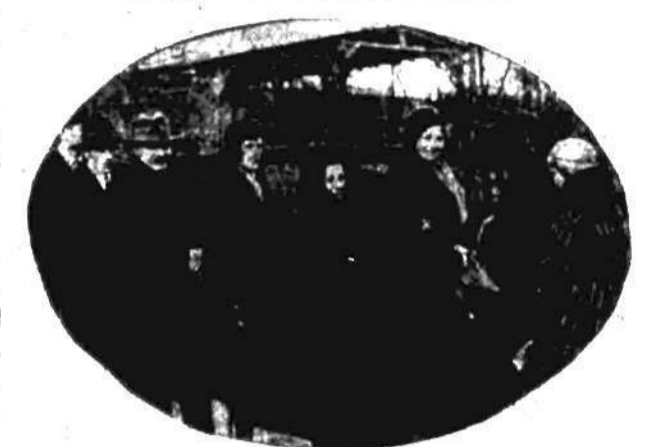
MARJA MODZELEWSKA W KOLEJCE Najznakomitsza aktorka polska młodego pokolenia, Marja Modzelewska, nie zaniedbała również wczoraj swego obowiązku wyborczego i złożyła swój głos w komisji obwodowej przy ul. Młedzeszyńskiej 2, na Pradze.

z wyszczególnieniem cen: „Golenie 60 gr., strzyżenie z uczesaniem 1 zł. 20 gr., mycie głowy amerykańskim szampoo 80 gr.