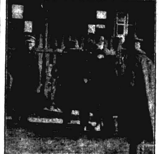
W drodze do komisji wyborczej w Warszawie.

Posiadaliśmy liczne prochownie, z których największą sławę uzyskała królewska „officina pulveraria” w Krakowie, młyny w Czajewicach i młyny lwowskie. Skład chemiczny prochu zmieniał się zależnie od rodzaju broni. Dla dział długich stosunek był następujący: siarki 38 proc., siarki 38 proc. i węgla 24 proc. Do muździerzy: siarki 60 proc., siarki 26 proc. węgla 14 proc.