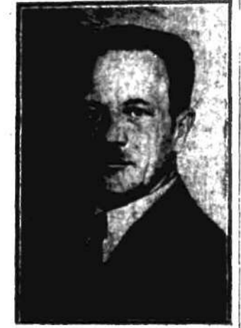
wygłosił dziś o g. 5 m. 45 w sali Filharmonii w Warszawie, w wielkim zgromadzeniu przedwyborczym, odczyt na temat: „O co walczymy”.