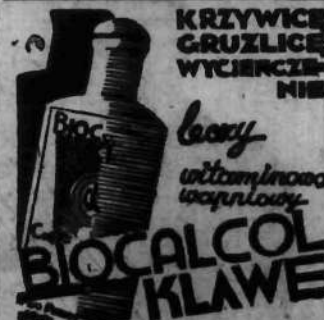
Wzrost i siła dzięki BIOCALCOL KŁAWE

Po chwili, kiedy chciał ją wydobyc z ukrycia i ciągnął za lufę, spadł strzał kładąc trupem Walkuskiego.