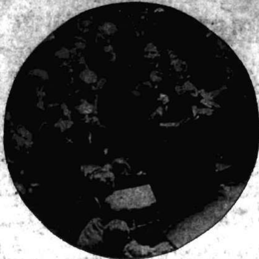
Jedną z ostatnich sesyj parlamentu francuskiego, jak wiadomo już z depesz, stała się wielką manifestacją na rzecz Polski. Na sesji tej potępiono politykę Brianda i wszystkie zakusy rewizjonistów. Oznaczony (x) premier Tardieu przemawia z ław ministerjalnych.