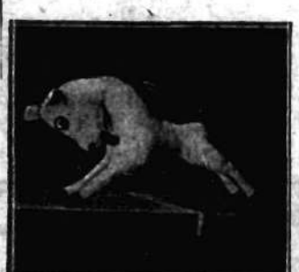
Pegaz — symbol poetyckich natchnień i wzlotów — maskota dla lotników i wszelkich podróżaczy przestrzeni.