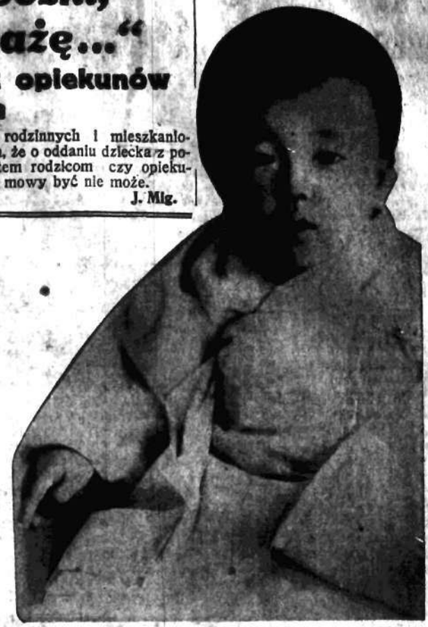
Księżniczka Takanomija, trzecia z rzędu córka japońskiej pary cesarskiej, obchodziła pierwszą rocznicę urodzin.