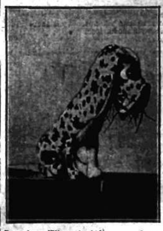
Pocztowy Wiernus, który w zatrąsaniu coś sobie sumuje — czyż to nie oddany i pewny przyjaciel, przynoszący szczęście w domu?