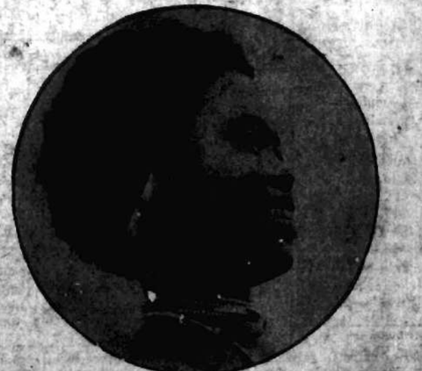
Piękność murzyńska z wysp Filipinó w nosi w uchu flaszeczka zawierająca wonna esencję z ziół leśnych.