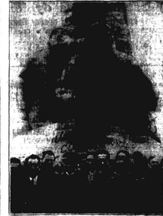
Zwycięzcy oceanu Bellonte (1) i Costes (2) składają w dzień Złoty dzień na pomniku Nussgerera i Cell, świąt królewskich poprzedników w locie nad Atlantykiem.