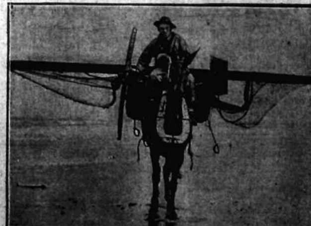
Tak groteskowo wygląda rybak belgijski w okolicach Ostendy, wyrzuciwszy na pół w morze.