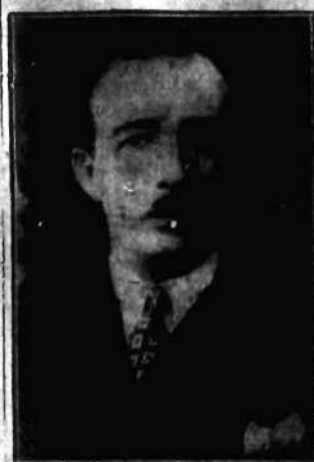
Król Albanii Achmed Zogu ciężko choruje na raka w gardle