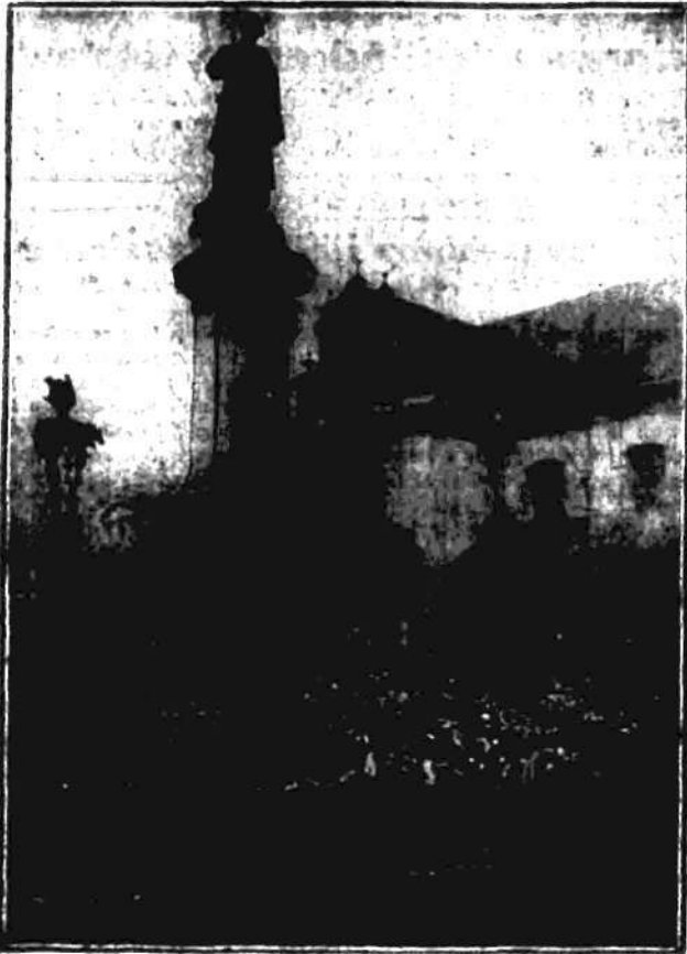
U STÓP POMNIKA WIESZCZA