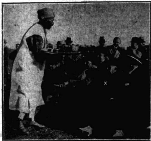
Dechmistrz jednego z szefów marokańskich podaje prezydentowi Doumergue (x) sorbet w czasie pobytu prezydenta w Dжебel Eldride.