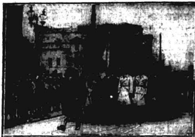
ZE SZTANDARAMI SZKOLNEMI NA CZELE Wielki pochód młodzieży gimnazjalnej.

W drugim dniu roczystego obchodu dwudziestej piątej rocznicy walki o szkołę polską, odbył się wczoraj przed południem w Warszawie wielki pochód młodzieży szkół średnich i po-