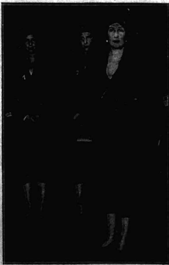
Królowa hiszpańska przybyła onegdaj do Paryża z swoimi córkami, Beatryczą (1) i Marią Krystyną (2). Pobyt królowej z matką w Paryżu pogodził w związku z planami małżeńskimi jej córki Beatryczy.