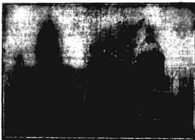
Warszawski ewangelicki kościół garnizonowy na terenie pierwszego pułku lotniczego na Mokotowie, w którym wczoraj dokonano roczystego poświęcenia nowych drzwi.