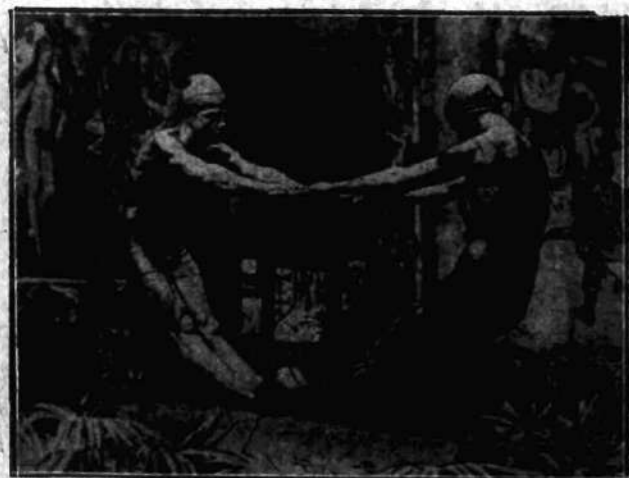
Na otwartej w tych dniach wystawie narodowej sztuki hiszpańskiej w Madrycie zwraca ogólną uwagę piękna rzeczba Miguela Alvarca „Na plaży”.