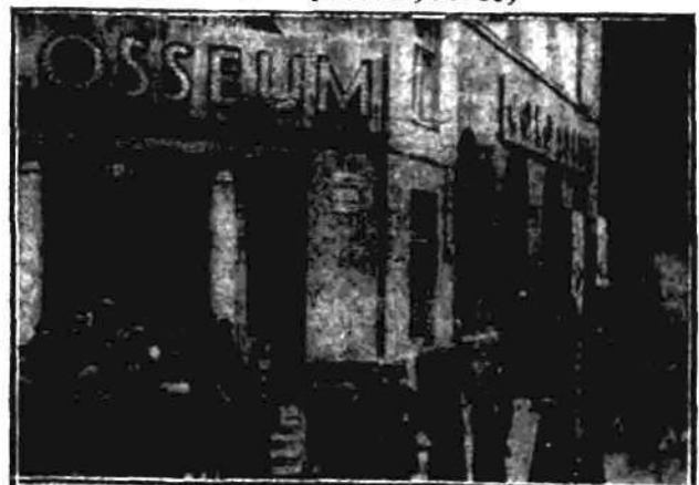
Wielki zgromadzenie wczoraj na wiecu, zorganizowane w wielu punktach miasta przez Blok Bezpartyjny.

wszechnych przez całe miasto pod pomnik Mickiewicza, gdzie delegacje wszystkich szkół złożyły wieńce.