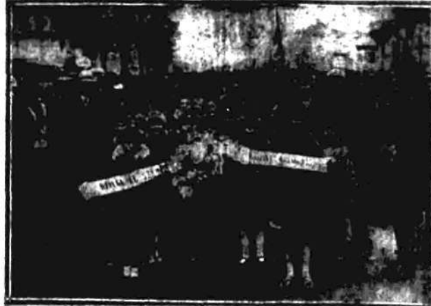
POCHÓD DZIAŁY SZKOLNEJ

Druga akademja odbyła się o 17.00 w sali Filharmonji. Przemówienia wygłosili: wzytator St. Dogodz. 3-ej po południu w wiel-