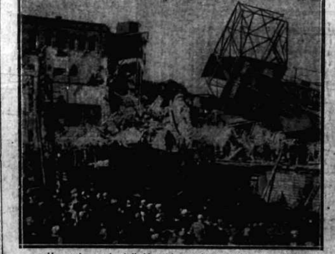
Usuwanie gruzów i śladów zniszczenia, wywołanego wybuchem.

Stwierdzić należy, iż Polska ma prawo zatrzymać na granicy transporty niemieckie, o ile nie odpowiadają one wymaganiom polskich przepisów weterynaryjnych. Tembardziej, że między Polską a Niemcami od lat trwa spór w sprawie międzynarodowej konwencji weterynaryjnej, orzeczony Niemcy domagają się