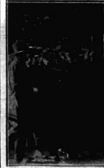
Rodziny zabitych w katastrofie górników.

jaknadjalej idącego zaostżenia przepisów. Z punktu widzenia handlowego zakupy sowieckie w Niemczech są nonsensem, ponieważ nierogaciznę tej klasy nabyć można było w Polsce taniej, a przytem zaoszczędzić znaczne sumy na transporcie. Zakupy te mają więc niewątpliwie podłoże polityczne.