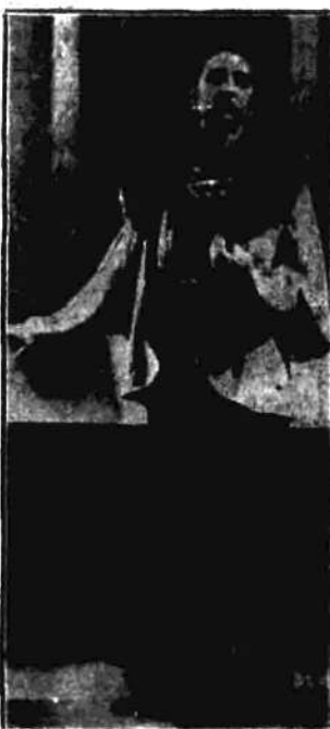
Piękna, czarna Fort-towa sukienka i jasne, k. Arkie, a. 10.10.1930 r.