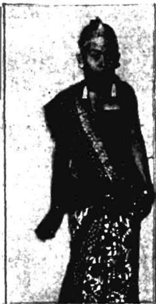
Tancerka przy świątyni chińskiej

Widok niesamowitych postaci całymi godzinami tańczących z niezrozumiałą wytrwałością przy dźwiękach piskliwej, rozzwierającej uszy muzyki wprawia tłum wyznawców w stan ekstazy religijnej, graniczącej z hypnozą.