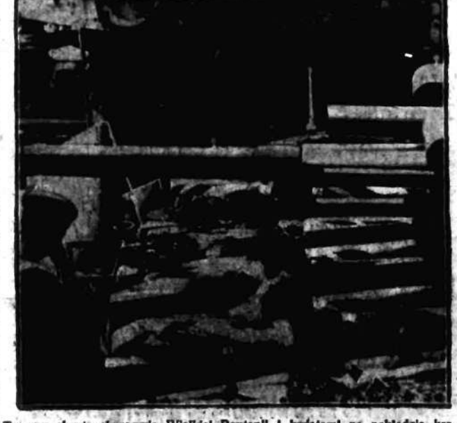
Trumny okryte chorągwią Wielkiej Brytanii i kwiatami na pokładzie krążownika „Tempest” w chwili dopływania do brzegów Anglii.

Władze rządowe twierdzą, że powstańcy zawładnęli całkowicie jedynie prowincją Rio Grande do Sul, natomiast w stanie Minas Geras wojska rządowe zdobyły stłumić ruch rewolucyjny. Odbicie Bello Horizonte ma być kwestią kilku godzin. Pod naporem wojsk rządowych powstańcy mieli opuścić zdobytą wczoraj Palmirę. Prezydent Lutz, który, jak się okazuje, nie ustąpił, oświadczył dziennikarzom zagranicznym, że wojska pozostają wiernie rządowi. a mobilizacja rezerwistów postępuje pomyślnie naprzód.