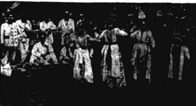
Młode indochińskie tancerki, wychowywane przy świątyni od dzieciństwa.