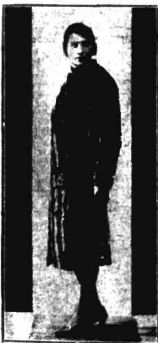
W Paryżu pojawiły się furrane kostiumy. Czy się ta moda przyjmie — widać z czasem.