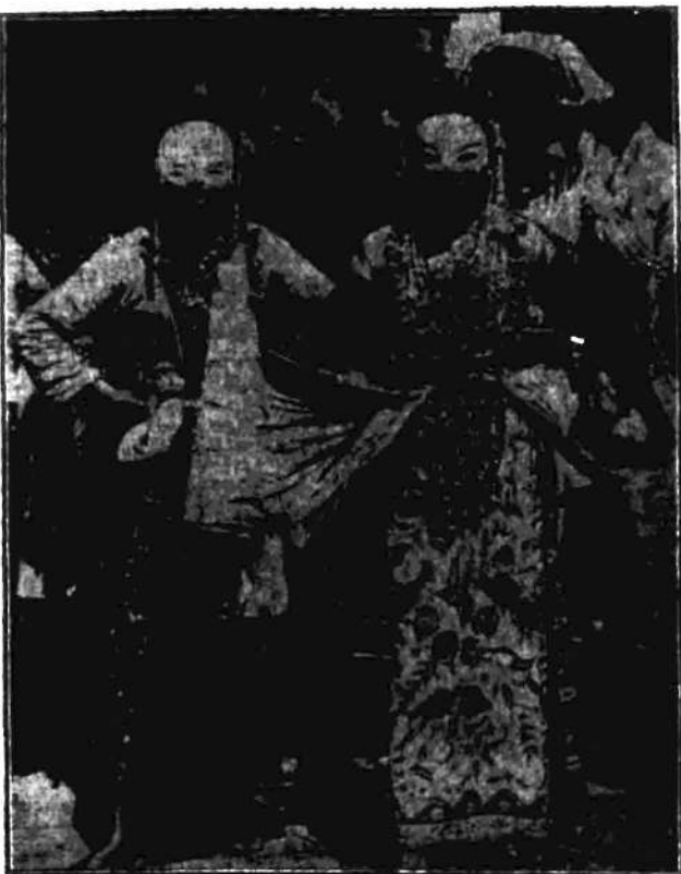
Zamaskowane tancerki rytualne w indochińskiej procesji religijnej.