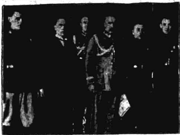
Marszałek Piłsudski przyjął wczoraj delegację Związku podoficerów rezerwy