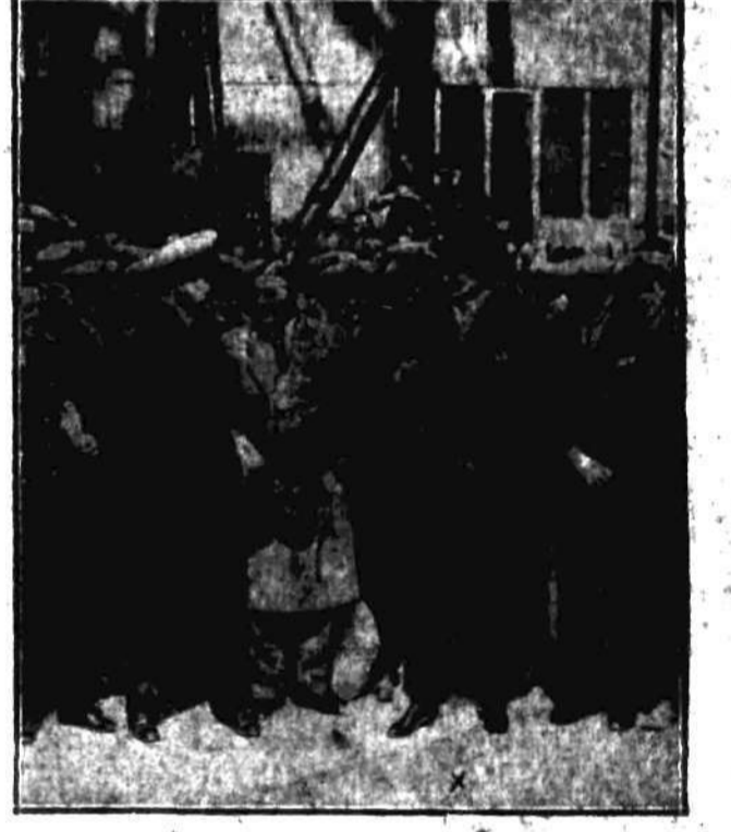
Angielski minister lotnictwa Thomson, według fotografii zrobionej przed kilku tygodniami, gdy wital się z żałobą sterowca R 100 po przylocie z Kanady.

PARYŻ, 7.10. Prace nad wydobywaniem zwłok z pod zgłiszcz „R 101” zostały już ukończone. Ogółem znaleziono 46 zwłok i zarazem rozwiązano zagadkę 47-go trupa, który należał miał do rzekomego „pasażera na gape”. Okazało się, że zwłoki były tak strasznie zniekształcone, iż pewne części spalonych ciał umieszczono w osobnej trumnie, jako odrębne zwłoki. Przez pewien czas myślano również, iż wśród ofiar katastrofy znajdowała się kobieta, gdyż znaleziono w zgłiszczach damski pantofelek. Okazało się jednak, iż pantofelek był maskota, zabrana przez jednego z pasażerów. Narazie udało się ustalić identyczność jedynie 5 zwłok. Władze angielskie zwróciły się do rodzin ofiar katastrofy, by wobec niemożności rozpoznania zwłok, pochowano wszystkie razem w jednym wspólnym grobie. Mogła ma stanąć w pobliżu lotniska w Cardington, a na niej u-