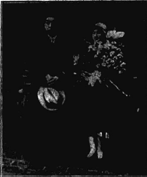
Jedno z ostatnich zdjęć przybyłego wczoraj do Warszawy ks. Takamatsu, brata cesarza Japonii. Obok księcia jego małżonka.

obalić szoguna. Wobec tego szogun Tokugawa Keiki oddał dobroćojnie w r. 1867 cesarzowi Meiji ster władzy, uznając powojnę podczas blisko 700 lat. Cesarz miał wówczas 16 lat, jednakże przy pomocy rozumnych mężów stanu sprawował rządy bar