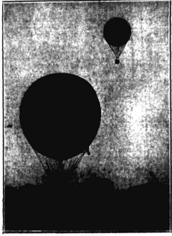
o puhar im. płk. Wańkowicza.