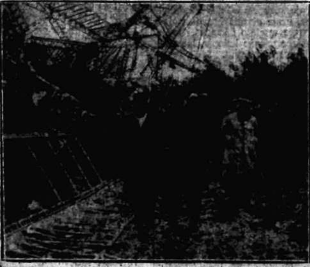
Francuski minister dotychczas tymac na miejscu katastrofy stowca R. 101 pod Beauvais.