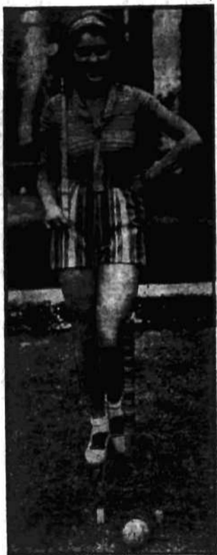
Oryginalny kostium sportowy z wzorzystej wlny wprowadzony w Ameryce przez nadobną Miss Lillian Roth. Czyżby i u nas nie można zastosować przepięknych welen łowieckich i kurpiowskich pasiaków?

wyższą nagrodą „Grand Prix”, powstała spółka pod nazwą „Pol spirit”, mająca za zadanie import i sprzedaż produktów polskiego monopolu spirytusowego na obszarze Belgii, Konga Belgijskiego i W. Ks. Luxemburskiego.