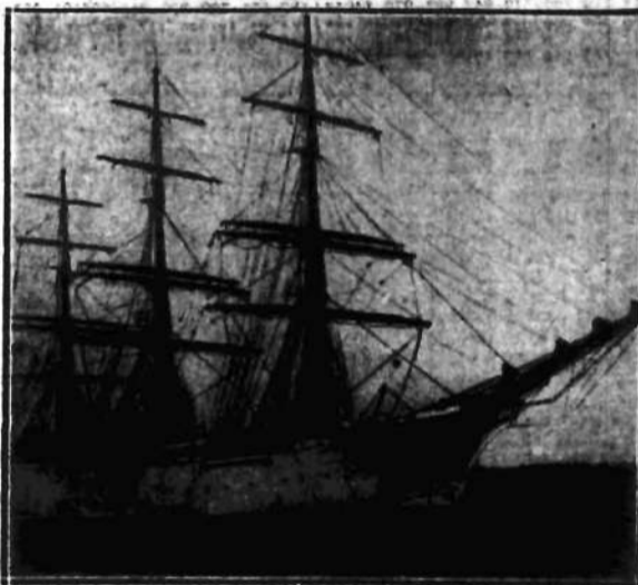
Statek polskiej marynarki handlowej „Dar Pomorza” po odbyciu pierwszej podróży zawinął do portu w Gdyni.