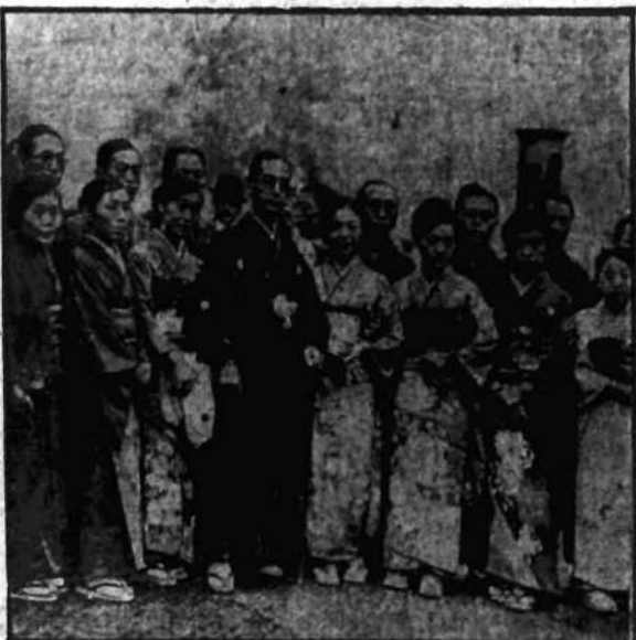
Zespół artystów jednego z teatrów tokijskich odbywa tournée po Europie.