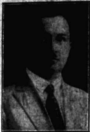
Dyrektor agencji „Russpress, która obchodziła 10-letnie istnienie.