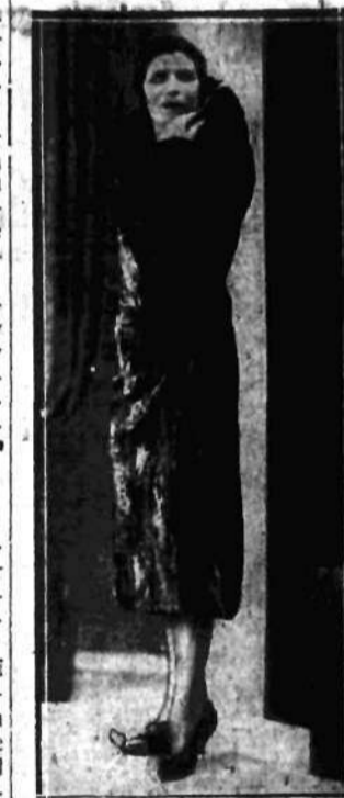
Plaszcz jesienny ze żrebców. Obcisły z sutym kołnierzem.