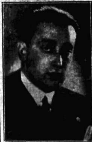
Jeden z najpracowitszych reżyserów polskich przystępuje do realizacji komedji dźwiękowej.