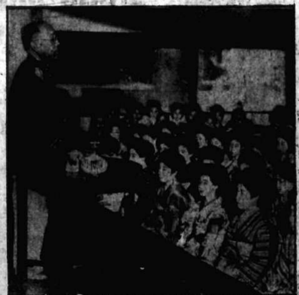
F. Ięki polski w Tokio na specjalnej konferencji dla panien z najlepszej klasy dzieli się swymi uwagami na temat upadku obyczajów.