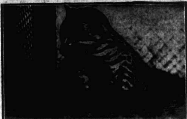
Ocelet, rzadki okaz drapieżnika w warszawskim ogrodzie zoologicznym.