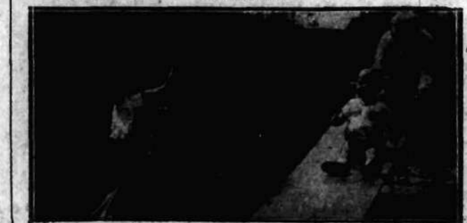
I takie małe bobo również odawia zapasy zdrowia.