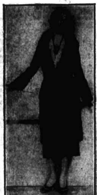
Piękna całość jesienna, składająca się z sukienki czarnej spódnicy i trzyćwierciowego płaszcza z tegoż materiału, bogato przybranego karakulami.