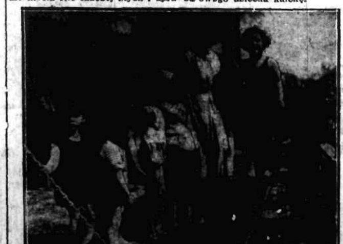
Ćwiczenia na żółtkowanej deseczce sprzyjającej prawidłowemu rozwojowi nóg i sióp.

Sięgniemy po sporty, gimnastykę, rozwijamy swe płuca, serce i mięśnie nie dlatego, żeby zdobywać rekordy i mistrzostwa w rzucie kula, czy biegu z płotkami, ale żeby osiągnąć rekordy w dziedzinie myśli. Kto więcej myśli i upra-