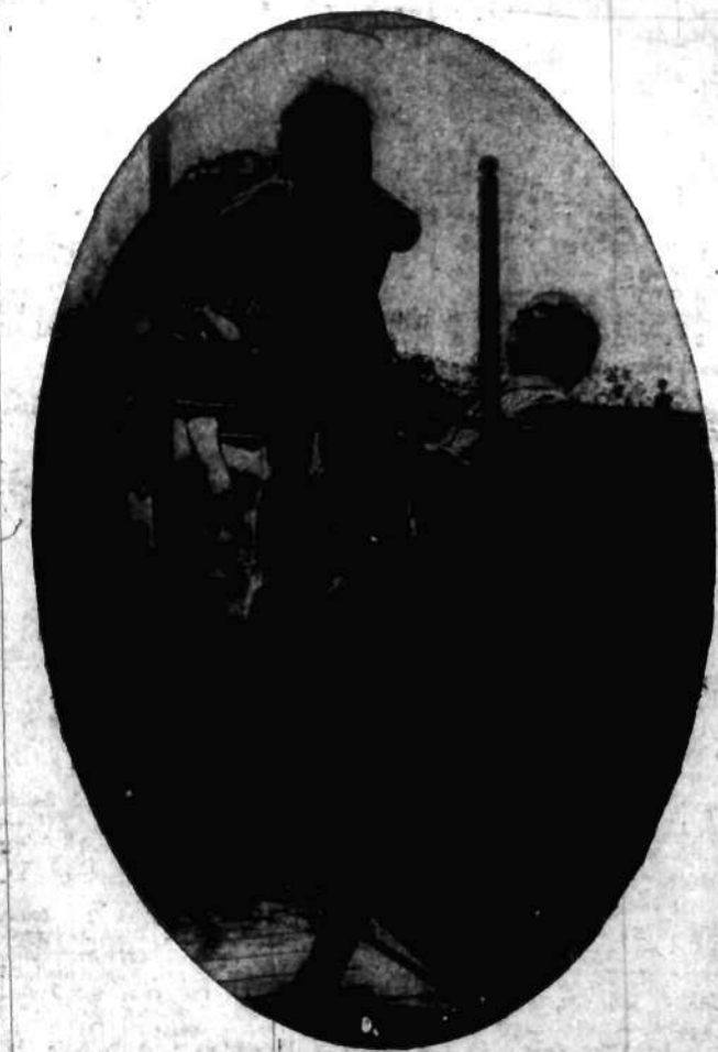
Po gimnastyce mała koleżka popatrza wkołyszoną lizawę.