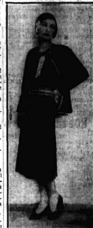
Kostium z czarnej miodowej wełny, przybrany szydełkowym welnianym obramowaniem oraz ożywiony żabotem.