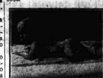
Pierwsze ćwiczenia nóg kilkuniesięcioletniego dziecka.

wia sport inaczej, ten nie rozumie jego znaczenia w życiu. Gimnastykę należy rozpoczynać jak najwcześniej. Nawet kilkumiesięczne dzieci mogą już uprawiać ćwiczenia cieleśne, naturalnie przy pomocy wychowawców, Sztuki tej powinni się nauczyć wszyscy rodzice, gdyż nawet dzieci w okresie przedszkolnym powinny uprawiać gimnastykę i sport. Daj im to zapasy zdrowia i siły i pozwól im później, podczas nauki nie odczuwać zbyt zużycia, szybko przetażającego się w leniwość i niezdolność.