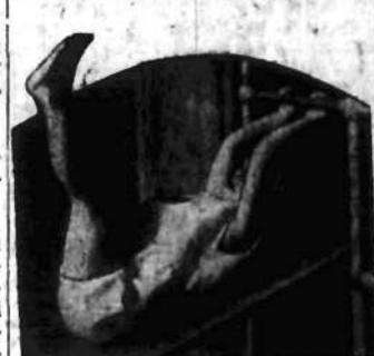
Elementarne ćwiczenia dwuletniej dziewczynki na trapezie.

Dajcie gimnastykę dzieciom a wyrosną z nich zdrowi i energiczni ludzie