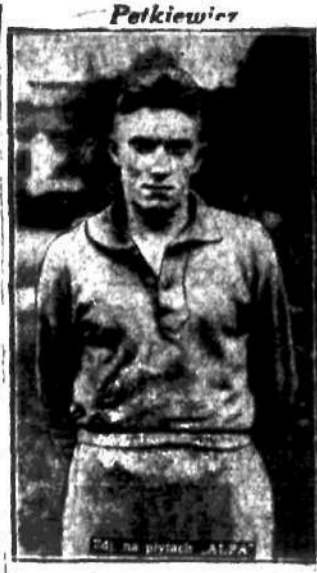
chłuba polskiego sportu, zwycięzca Nurmego, staje z nim po raz drugi do walki w Warszawie.