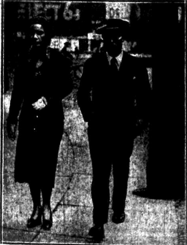
Słynny komik Buster Keaton odbywa wraz ze swą małżonką podróż po Europie.