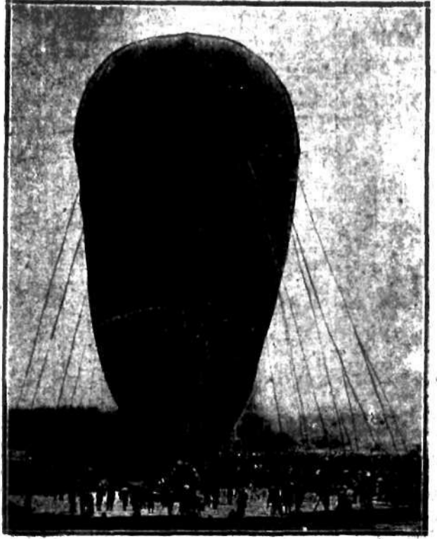
Start balonu z kulą aluminiową, którym prof. Piccard zamierzał wznieść się na wysokość 16 km uległ odroczeniu, gdyż gumoła w kształcie buta odkształcała się za ciężką.