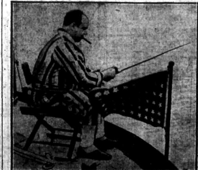
Król podziemi. Al Capone, beztrąsko łowi ryby.