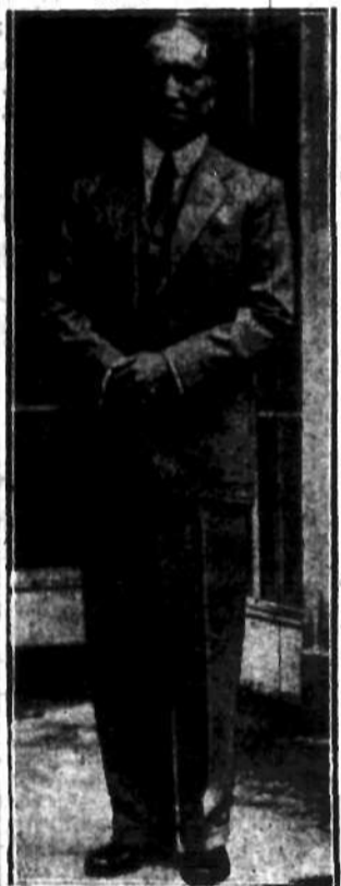
— Mam bardzo dużo do czynienia z Polakami w Ameryce, prowadzę walkę w ich imieniu.