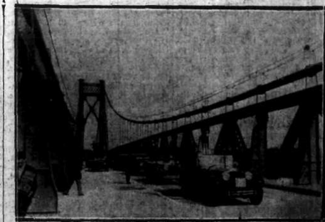
Otwarcie mostu na rzece Hudson, w konanym koszcie 6 milionów dolarów.