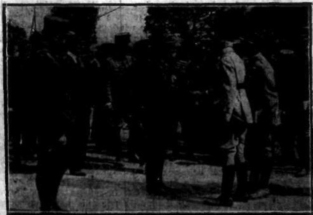
Grupa cudzoziemskich attachés wojskowych. Na zdjęciu marszałek Lyautey z jego żoną i kochanką. Zdjęcie wykonano w Paryżu.