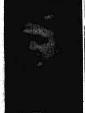
Ks. Ignacy Skorupka, poległy w bitwie pod Ossowem, dnia 15 sierpnia 1920 r.