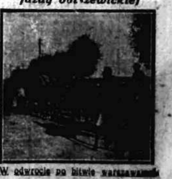
W odwrocie po bitwie warszawskiej