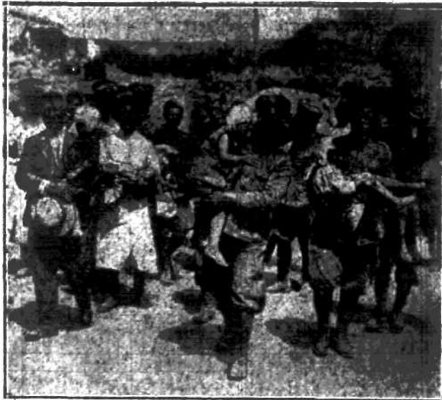
Karabinierzy włoscy ratują dzieci w jednym z miast, zniszczonych trzęsieniem ziemi.