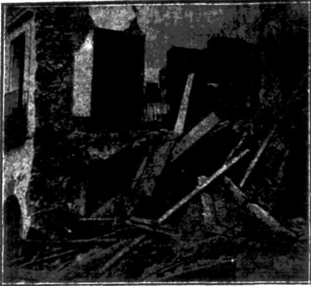
Wnętrze jednego z domów w Villanuova, po doszczętnym zniszczeniu przez trzęsienie ziemi.