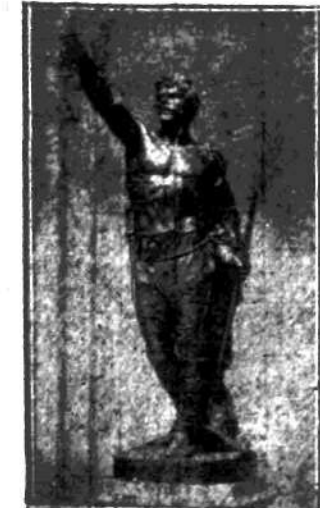
W najbliższym czasie ma stanąć w parku warszawskim pełna potęgi i flagizmu rzeźba „Gładjator”, słynnego artysty Plusa Welońskiego.