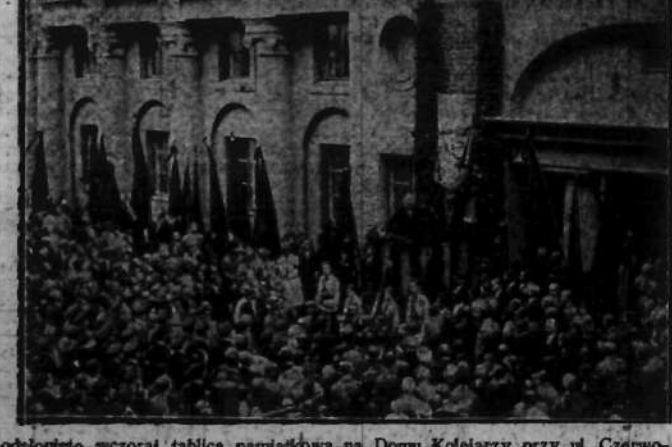
odsłonięto wczoraj tablicę pamiątkową na Domu Kolejarzy przy ul. Czerwonego Krzyża w Warszawie.