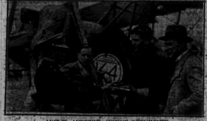
ANGLIK ANDREWS WIZUJE DOKUMENTY. Pilot awjonek „K. 4” w chwili po wylądowaniu wręcza swe papiery post-Kościeńskiemu.

BIAŁOGÓRÓD, 27.7. Zmarł tu wczoraj b. premier i wielokrotny minister Marko Trifkovicz. Zmarły urodził się w r. 1864. Od r. 1896 do 1927 był on stale deputowanym partii radykalnej. (PAT.)