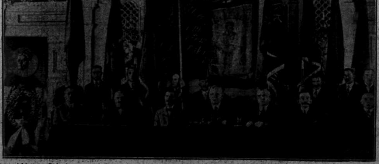
Na Rabazie stożkowym odbyła się wczoraj akademię ku czci Stefana Okrzei. Na zdjęciu prezydium uroczystego zebrania.