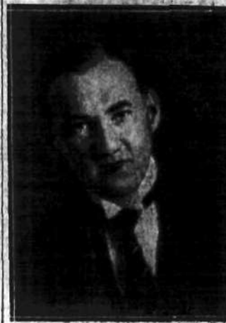
Kazimierz Fajans z Warszawy, prof. chemii fizycznej Uniwersytetu w Monachium.