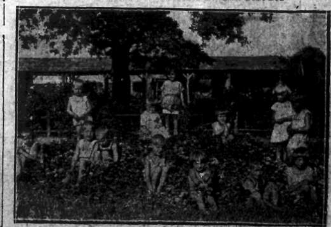
Kolonje dzieci — sierot w Rogoźnie — Zamku na Pomorzu, stanowiącym własność T-wa włosek Kościuszkowskich.