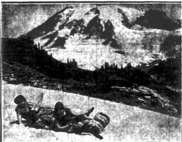
W jednym z amerykańskich parków narodowych można używać w lecie sportów zimowych, dzięki wiecznym śniegom u stóp lodowca.