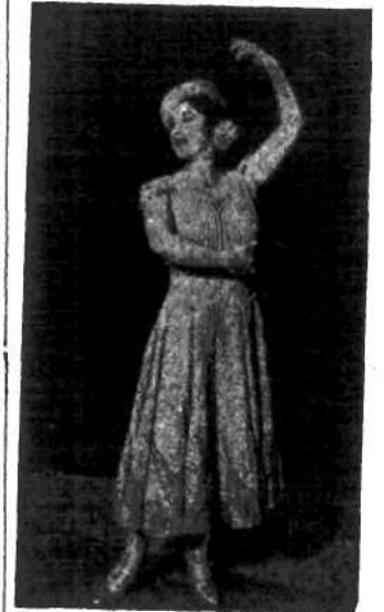
Artystka kabaretowa, tancerka „La Argentina” otrzymała w tych dniach Legię honorową za wysoką klasę swojej produkcji tanecznej.