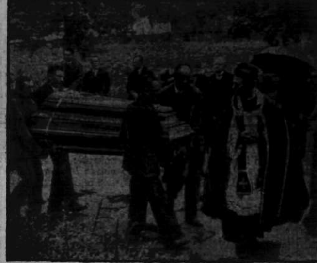
Ekspozycja zwłok z domu żałoby na stację kolejową w Milanówku, skąd trumna przewieziona do Krakowa.