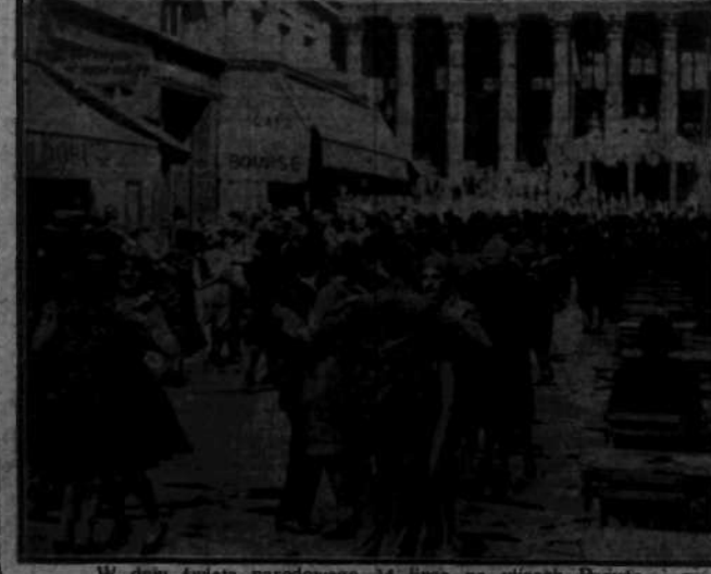
W dniu święta narodowego 14 lipca na placach Paraja.