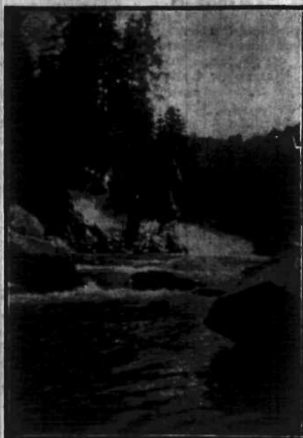
Dolina Prutu w okolicach Jaremcza słynie z wspaniałych widoków przyrody. Rok rocznie liczniejsze wycieczki zwiedzają ten uroczy zakątek.