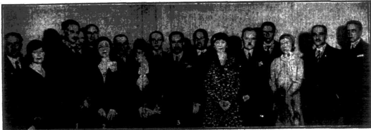
Włoski wiceminister komunikacji Penavaria (3), jego małżonka (2) oraz generalny dyrektor kolei i portów bułgarskich Boszkow (4) na śniadaniu u min. Kuhna (1).