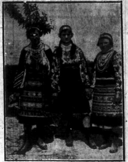
W najbardziej południowych okolicach Polski, koło Zaleszczyk spotkać można urodziwe typy wieśniaczek w barwnych, bogato wyszywanych strojach.