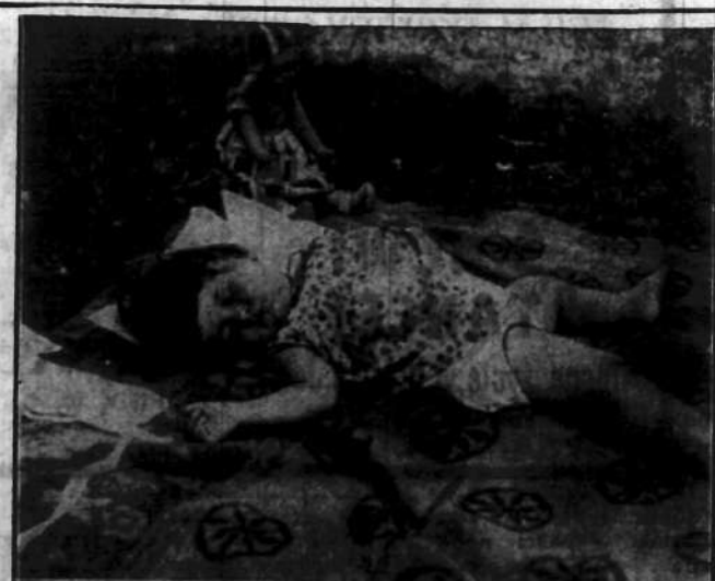
Zmudne dreptanie za kurkami i pleskami, skomplikowana zabawa na gorze plasku, zmogła półtoraroczna dziewczyna i jej „laję”. — Zasnęły.