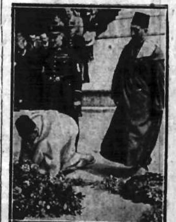
Sułtan Marokka, Mulej-Hafid, składa wieniec na grobie Żołnierza Nieznanego w Paryżu.

— Z Madrytu donoszą, iż wskutek zawalenia się domu w Guadalajara cztery osoby poniosły śmierć, 7 ciężko rannych.