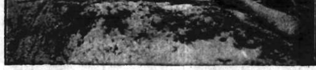
Sowieckie przysposobienie wojskowe kobiet przy „pokojowej” pracy. Zdjęcie przedstawia ćwiczenia w okopach.