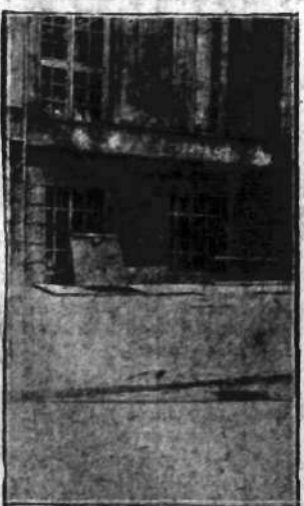
Okna skarbcza Banku Handlowego w Łodzi, w którym włamywacze uwieźli kasjera i woźnicę.

— W imieniu prawa ręce do góry! — zawołał policjanci, a biedak, z podniesionymi ku niebu