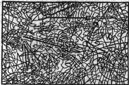
Wśród pogmatwanych linii należy odnaleźć 8 sztuk broni, zakreślić kontury.