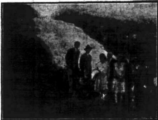
Wędrowni w Czerwonogrodzie wykonujący sztucznie przez larków, w czasie ich chwilowego wladania w w. XVII tamtejszei stronami Rzeczypospolitej.