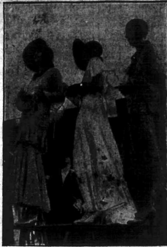
Piękne letnie suknie z powiewnych przezrzystych i wzorzystych materiałów, przybrane falbanami i pelerynkami. Noś je na eleganckie wizyty, zabawy ogrodowe, do kasyna w miejscowościach zdrojowych. Duże kapelusze - pastertki najodpowiedniejsze są do tych sukien.

— W Paryżu aresztowano generalnego dyrektora wielkiego towarzystwa ubezpieczeniowego, Pouleta, pod zarzutem sprzeniewierzenia 20 miljonów franków.