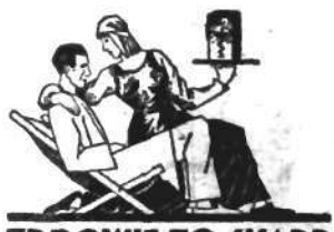
ZDROWIE TO SKARB

gólnie aktualne, wobec spodziewanego ruchu cudzoziemców z okazji wystawy komunikacyjno-turystycznej. Obce waluty mogą być przyjmowane według kursu określonego w tabelach nadsyłanych kasom przez Zarządy kolejowe.