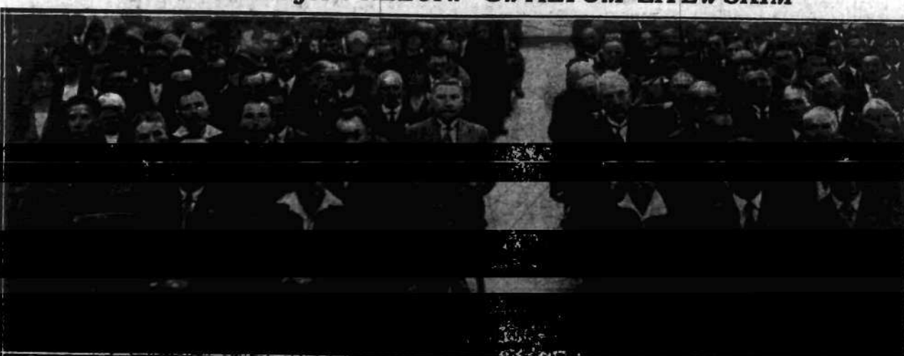
Wiec w sali rady miejskiej w Warszawie, na którym założono energiczny protest przeciw przeladowaniu Polaków na Litwie.