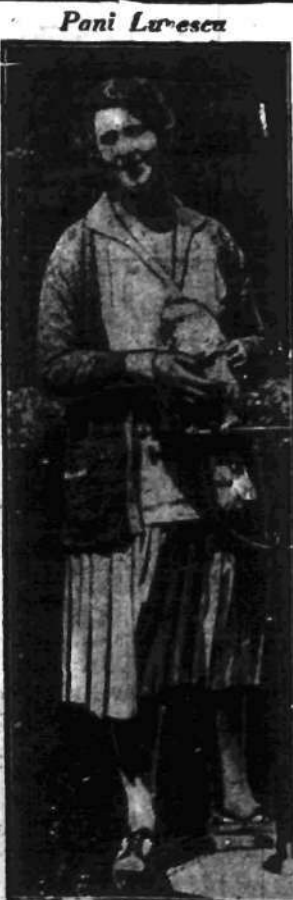
Ostatnio doniosły depesze, że b. przya ciotka króla Karola rumuńskiego ma przybyć do Bukaresztu. Powrót do ojczyzny umożliwił pan Lupescu stabilizacja stosunków na dworze rumuńskim.

KATOWICE, 17.6. — Ubiegłej nocy na przejeździe kolejowym między Szczakową i Maczkami wydarzył się wypadek, który omal nie pociągnął za sobą ofiar w ludziach.