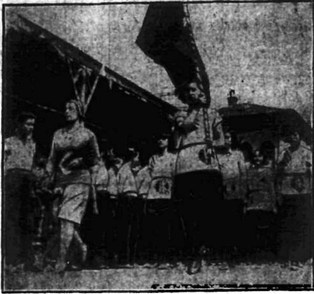
Wyzwolenie od wiekowych tradycji dziewczęta tureckie w pochodzie sportowym przez Konstantynopol.