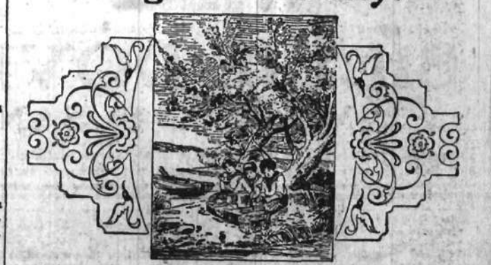
Trzech chłopców widzimy na rycinie. Gdzie podział się czwarty? Czytelnicy mogą go zrekonstruować.