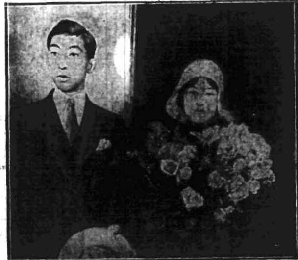
Księżstwo Takamatsu przybyć ma do Polski. Książę Takamatsu jest bratem obecnego mikada i bawi w Europie celem rewizyty księcia Yorku, syna króla angielskiego.