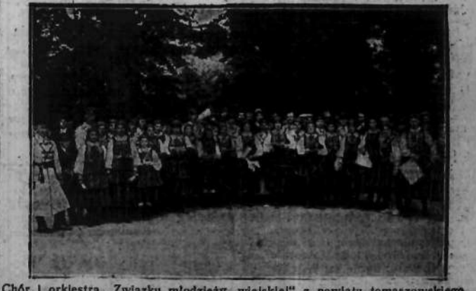
Chór i orkiestra „Związku młodzieży wiejskiej” z powiatu tomaszowskiego, które koncertowały z wielkim powodzeniem w Warszawie na rzecz kolonii letnich dla dzieci.