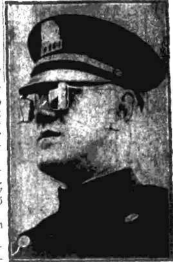
Amerykański policjant widzi z tyłu co się za nim dzieje, a to przy pomocy specjalnie skonstruowanych okularów.

Na miejsce przybyło kilku wviadowców policji, którzy prowadzą dochodzenie w związku ze znalezieniem tajemniczego gąsiora. (Kto).