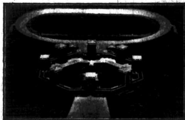
Pomnik zwycięstwa niemieckiego nad Rosją nad jeziorami mazurskimi