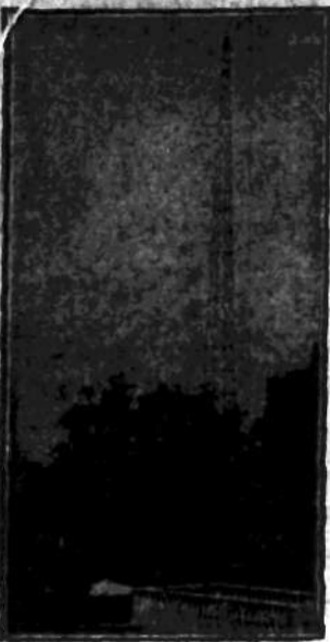
obok obserwatorium astronomicznego w ogrodach, należących do stolicy apostolskiej.