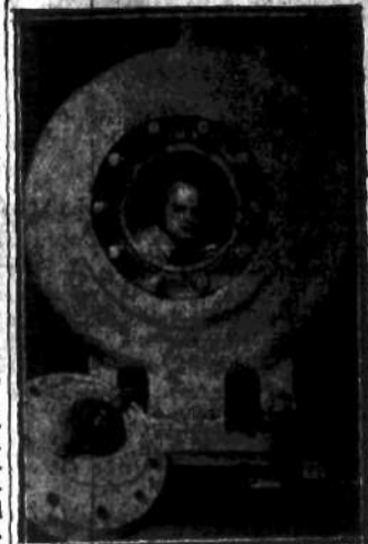
Nowy dzwon podwodny, pozwalający nurkom docierać do bardzo znacznych głębokości i umożliwiający dokonywanie zdjęć podwodnych...