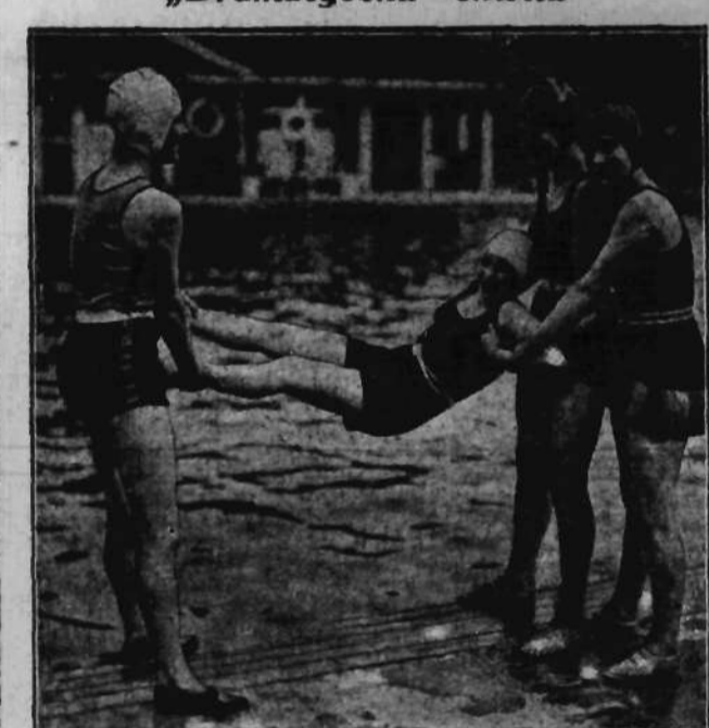
Wesoły „chrzest wodny“ w jednym z kobiecych klubów pływackich w Londynie.