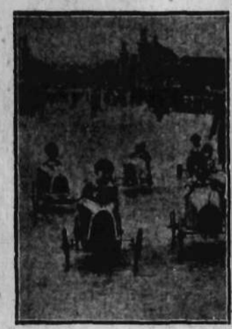
Zabawy na placach dla dzieci w ogrodach Paryża.