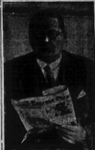
wieczerni wiceminister handlu i prezes Instytutu eksportowego bawi w Warszawie w sprawach zacieśnienia stosunków handlowych.