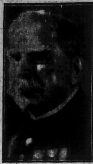
Marszałek Francji Joffre zaniemógł