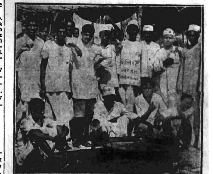
Oddana Gandhiewi młodzież hinduska warzy „sól niepodległości” nad brzegiem Oceanu Indyjskiego.