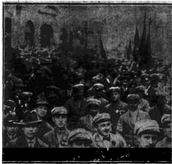
Fragmenty z dorocznego pochodu robotniczego w dniu 1-go Maja. Rzesze pracujące w pochodzie pod sztandarami organizacji politycznych i zawodowych, prowadzone przez przewodników ruchu robotniczego.