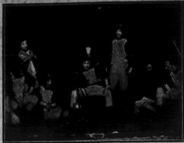
odegrany przez zespół Bandy w czasie akademii ku czci Marszałka Piłsudskiego w dniu 23 b. m.