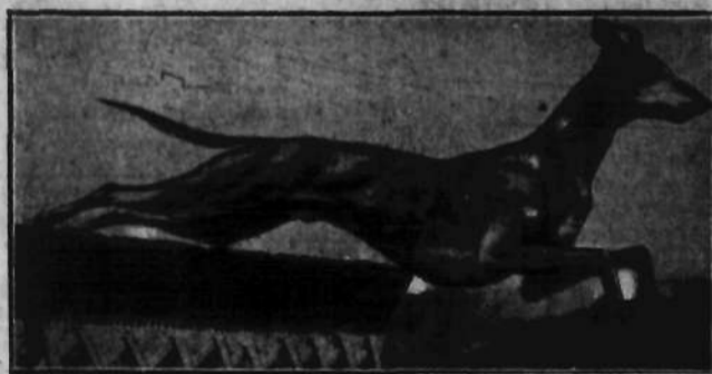
"Champion" ostatnich wyścigów "Merry Matt".