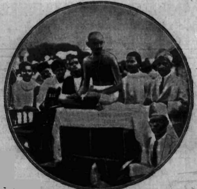
W dniu 2 b. m., w którym proklamował wypowiedzenie posłuszeństwa

BERLIN, 14.3. Wczoraj wieczorem grupa wyrostków umieściła na balustradzie Reichstagu beczkę ze smołą, którą następnie podpaliła.