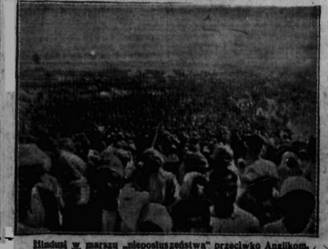
Induski w marszu „nieposłuszeństwa” przeciwko Anglikom.

BERLIN, 14.3. Wczoraj wieczorem grupa wyrostków umieściła na balustradzie Reichstagu beczkę ze smołą, którą następnie podpaliła.