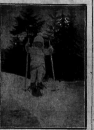
Maleńki narciarz szykuje się do wyczynów sportowych.