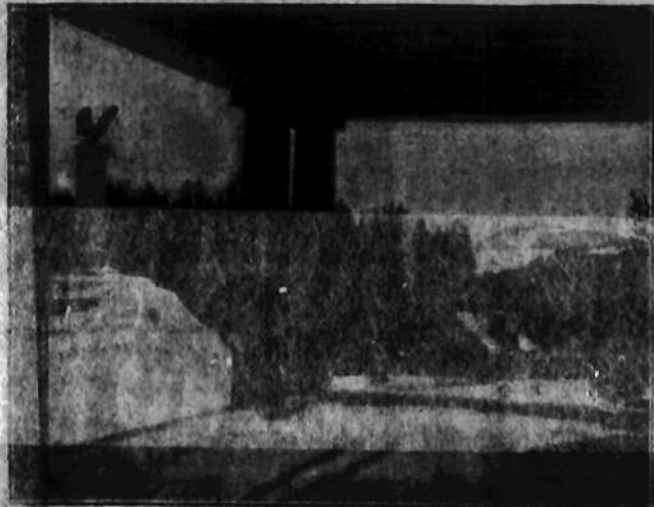
Fragment okopów Konfederatów Barских z parkiem i kopcem w Krynicy, pamięci ich wodza Pułaskiego poświęconym.