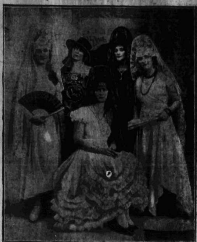
w efektywnym stroju piękności hiszpańskiej.