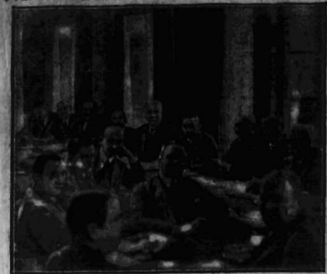
Wczoraj obradowały w ministerstwie komunikacji połączone komitety: eksploatacyjny i nowobudujących się kolei państwowej Rady kolejowej nad sprawami usprawnienia ruchu i nad projektami nowych linii kolejowych.