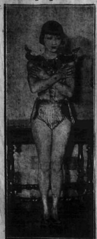
Anna May Wong w hieratycznym stroju tancerki chińskiej.