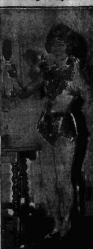
„Stodka Mary” jako sobowtór. Anny May Wong.