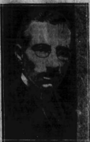
min. robót publicznych Italii, jeden z najwybitniejszych działaczy faszystowskich, zmarł 4 b. m.