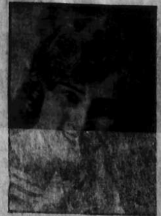
Nr 21 gl. 785—10 miejsce EWA KAROLAKÓWNA Zyrardów