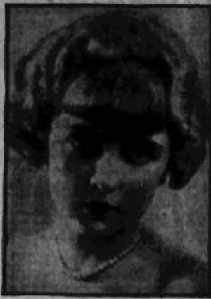
Nr 24 gl. 475—18 miejsce. I. HUETÓWNA Kraków