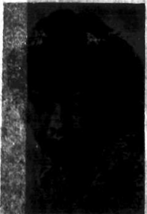
Nr 13 EUGENIA MUZYKÓWNA Poznań