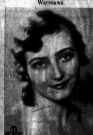
Nr 23 ZOFJA bar. ZACBERT Warszawa