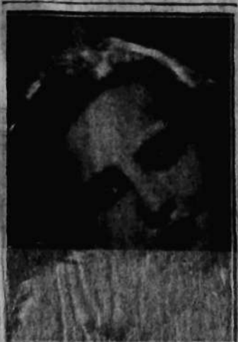
Nr 65 SŁAWA MAŁCZEWSKA Warszawa