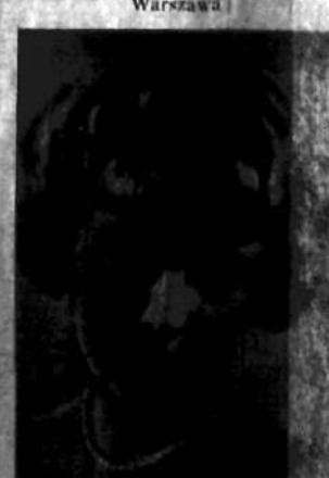
Nr 24 IRENA HUFTÓWNA Kraków