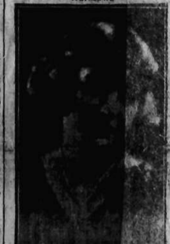
Nr 68 KRYSZYNA GWIDZÓWNA Kraków