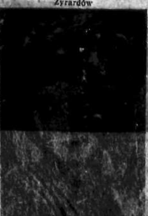
Nr 27 MARYCHNA NOWICKA Warszawa