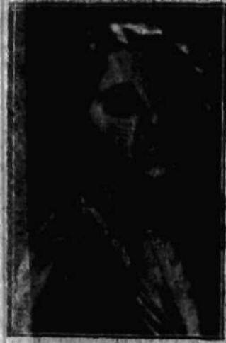
Nr 62 ŁARYSA CHRZANOWSKA Wilno