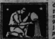
Pod tym względem już rano zapowiada się słońcu — i około godz. 9-ej mogą się przejawiać jakieś nieporozumienia w stosunkach i rozczarowania. Jest to wogóle gorszy czas dla obcowania z osobami płci odmienną, a również i zawierania spraw finansowych — i pod tym względem mogą nas spotkać zawody.

Pod tym względem już rano zapowiada się słońcu — i około godz. 9-ej mogą się przejawiać jakieś nieporozumienia w stosunkach i rozczarowania. Jest to wogóle gorszy czas dla obcowania z osobami płci odmienną, a również i zawierania spraw finansowych — i pod tym względem mogą nas spotkać zawody. Jeszcze i przed samem południem tym względem mogą nas spotkać z tymże tendencją gorsze nastroje. Po godz. 12-iej sytuacja się poprawia. Uważaj jednakże godzinę poobiednie nie padać się do nowych pozaryn i