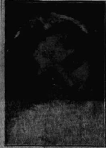
SŁAWA MAŁCZEWSKA Warszawa