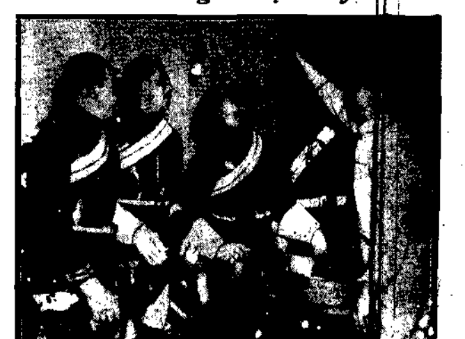
Angielska gwardia konna próbuje już puddingu gwiazdowego.