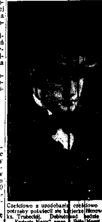
Częściowo z upodobaniem, częściowo z potrzeby poświęcił się karierze filmowej...