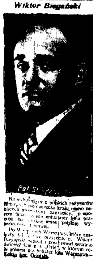
Na wysłuchaniu z policjantami reżyserów filmowych...