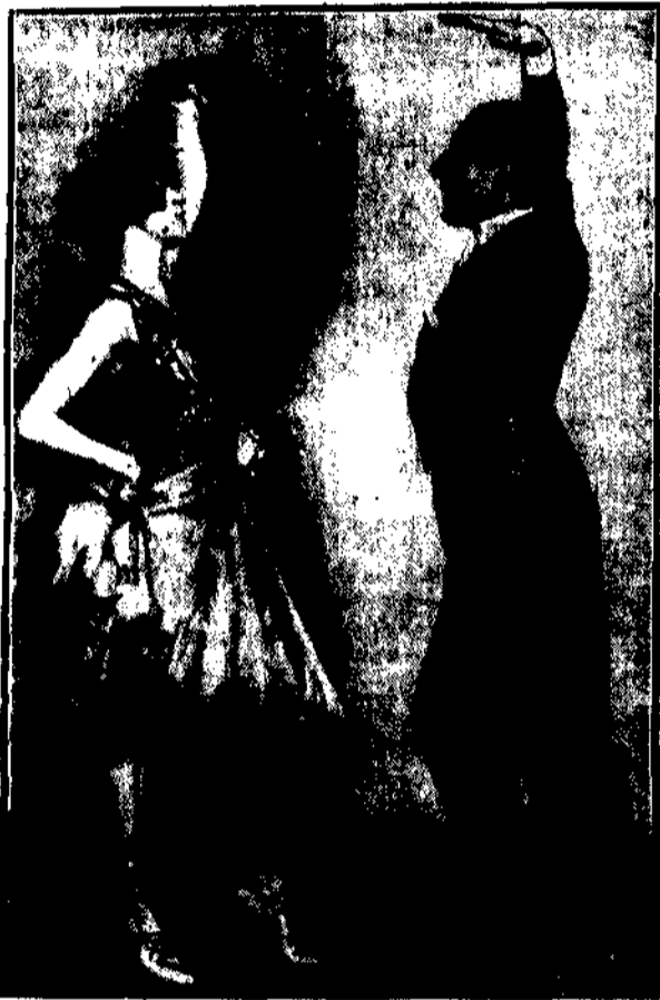
Wzrost, który ma wyrugować modnego charlestona. Zrodził się w mierzwiście...