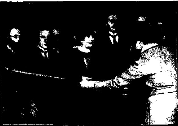
P. Prezydentowa Mościcka przecina wstęgę