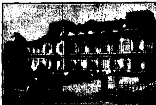
PAŁAC PASTWA PROMIENI. Zdjęcie przedstawia frontową część Zamku z kancelarią królewską na parterze i salę tronową na 1-em piętrze, które ukłódyły. Dwa boczne skrzydła, niewidoczne na fotografii, okazały się.