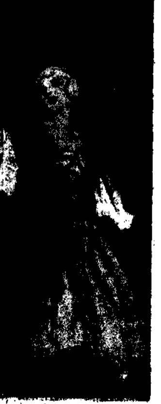
Dawniej długo czekało się na czule słowa — na jedno, ócz spojrzanie, jedyną uśmiech rękł. Dziś krótko trwa serc dwójka milosza rozmowa, no w modale wszystkie krótkie i rymy, uśmiech...