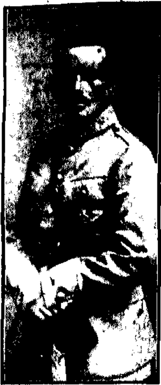
General Stanisław Buik-Bałachowicz, dowódca partyzanckich oddziałów w wojnie polsko-bolszewickiej...