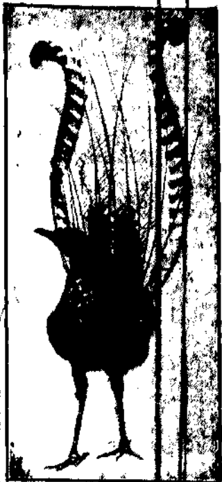
Muzeum nowojorskie posiada piękny okaz ptaka, pochodzącego z Nowej Walii, którego podobieństwo jest wspaniałym ogon w formie liry.