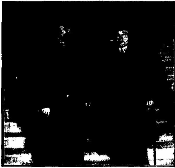
Minister Zaleski i ambasador Chişpowski po przyjęciu ich przez Brianda o-puszczają pałac na Quai d'Orsay.