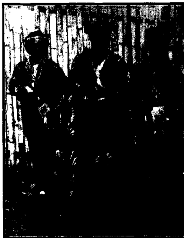
Mieszkańcy pięknych wysp Filipin odznaczają się niepospolitym smakiem w wyżywieniu i pięknym dekorowaniem w swoich stajniach.