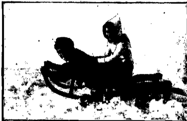
Zima jest również miłą porą roku dla dzieci... Byleby tylko śnieg spadł obficie.