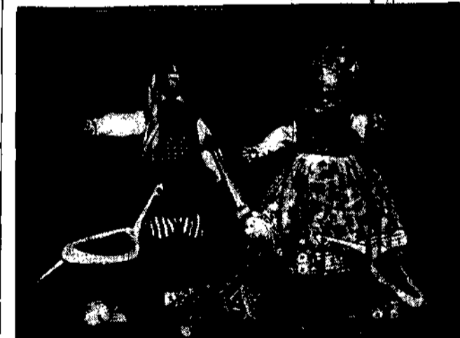
Lalki etnograficzne Polskiego Towarzystwa Przemysłu Ludowego oraz bochy pięknie wykonane i malowane po wetach polędki.