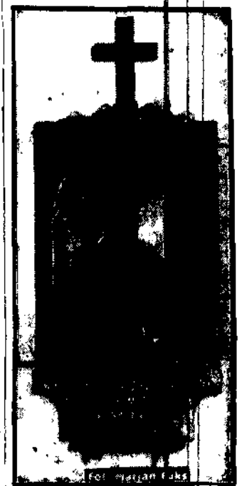
Wzrost pomnika arcybiskupa Ponieja w Katedrze św. Jana w Warszawie.