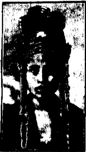
Młoda konkursowa piękność dotarła do Sjamu. Oto laureatka jednego z takich konkursów.