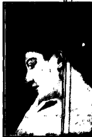
dla chłopców, wiec... białych nowość