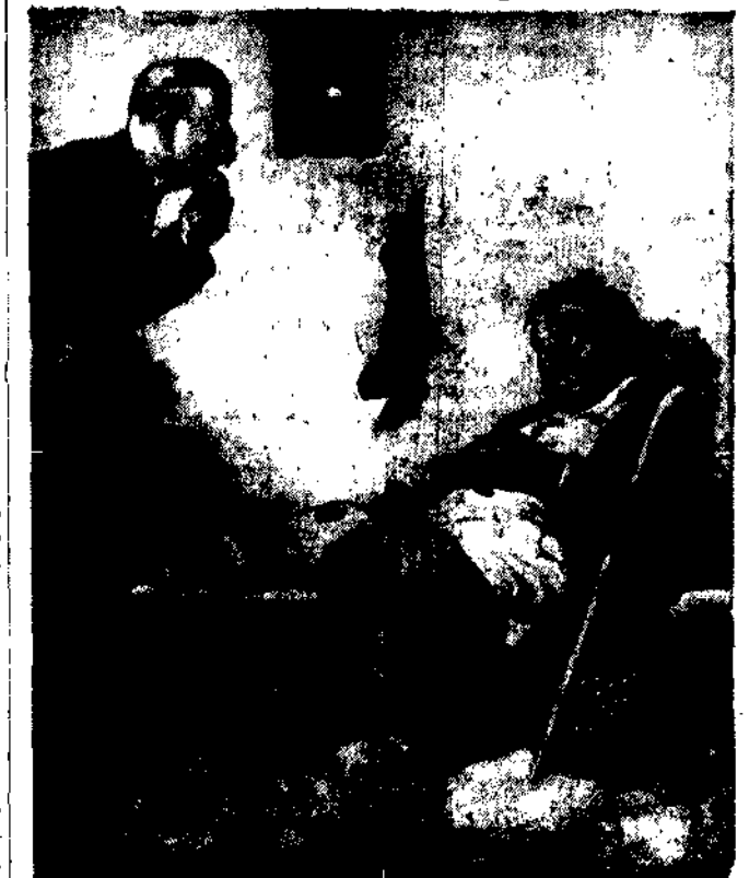
Areszt z wygodami