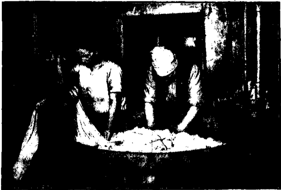
Pranie w domu! Sz. małżonek wymyka się chyłkiem, bo sz. małżonka rada zty humor na kimś zrealizować.