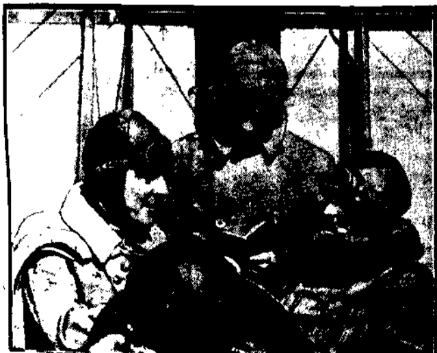
Odzież jak nie w Ameryce mógł taki pomysł przetrwać do głowy zakochanej pary!