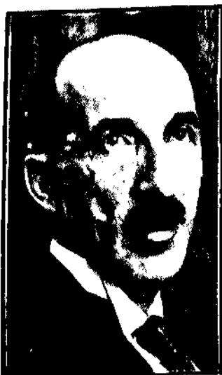
które przewodniczył w Paryżu na międzynarodowej konferencji o ośmiogodinnym dniu roboczym.