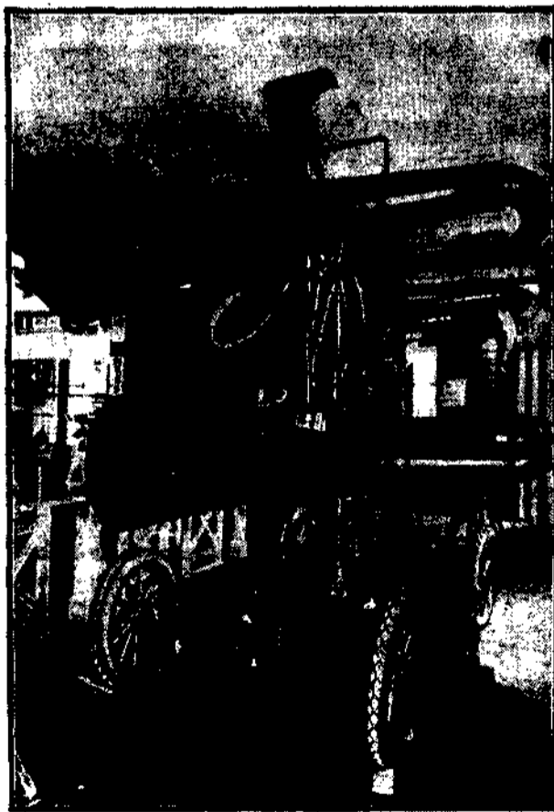
Aparat używany przez artylerię amerykańską. Zadaniem jego jest ustalić do- kładnie kierunek nadlatujących samolotów.