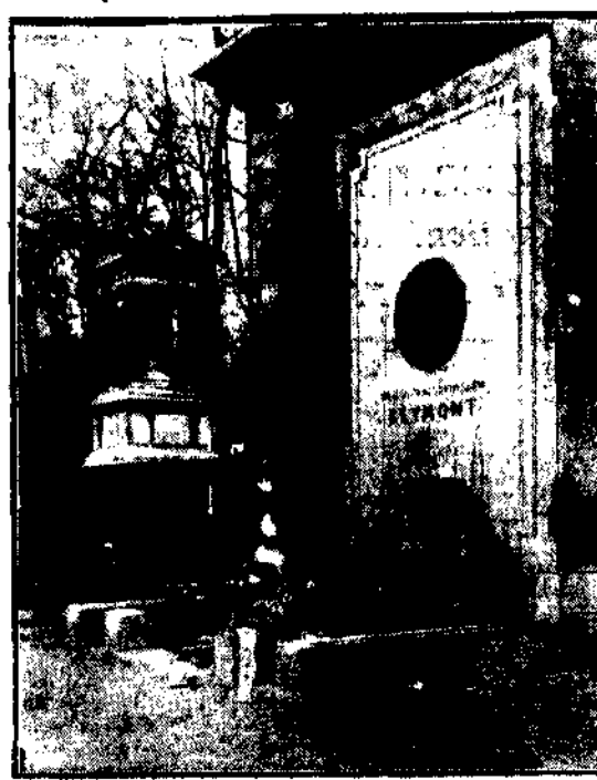
odbyło się wczoraj na skwerze powstalców, jako w pierwszą rocznicę śmierci wielkiego artysty