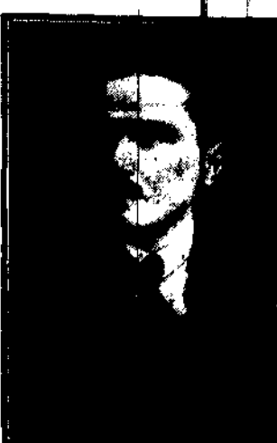
główny poseł polski w Rzymie (patrz str. 2)