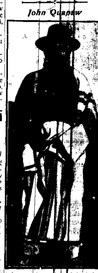
Jeden z młocnych wodzów indyjskich z Oklahomy. Z wielkim trudem udało się go ustawić przed obiektywem, wierzy on bowiem, że fotografia przynosi nieszczęście.

Węglewski uciekł w obawie przed skazującym wyrokiem, a znajduje się pomiędzy zwolnionymi.