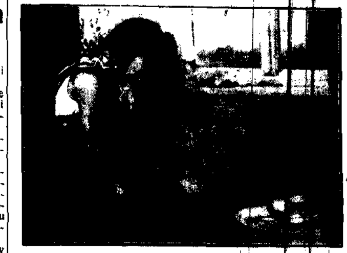
Dzieci biednych rodziców nie mają czasu na wesole igraszki i zabawki. Muszą od najmłodszych lat pracować i dlatego znają wartość pracy.