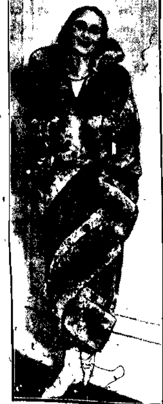
Anna Pawłowa po triumfalnych występach w Ameryce znowu wróciła do Łodzi z swoim zespołem. Wkrótce znowu tancerka zawita do Warszawy.