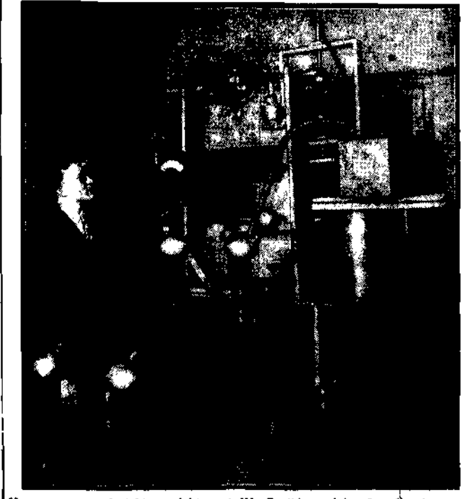
Ucznemu amerykańskiemu doktorowi W. Coolidge udało się odkryć nowe promienie elektryczne, siłą swą i działaniem przewyższające znane roentgenowskie promienie X. Ilustracja nasza przedstawia zwykłą banie szklaną wraz z akcesorjami, w której dr. Coolidge dokonał swego odkrycia.