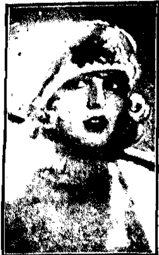
na zniżce, to biały sweter i także kapelusz z haftowanymi kwiatami.