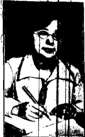
pierwsza Chinka, która zdała angielski egzamin adwokacki. Będzie ona praktykowała w Singapurze.