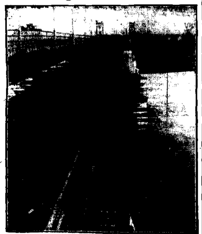
Dotychczas zakończona. Po montowaniu balustrad i oświetlenia tenże będzie mógł nareszcie służyć obu stron tej tak ważnej arterji miasta.