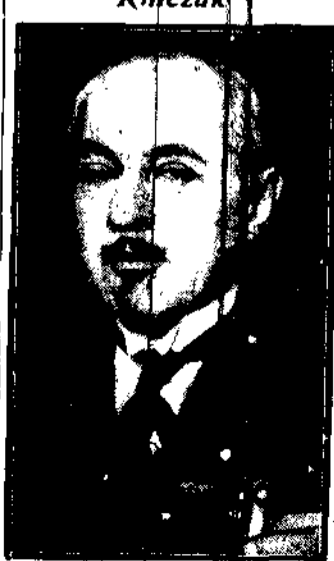
delegat handlowy Rosji w Londynie