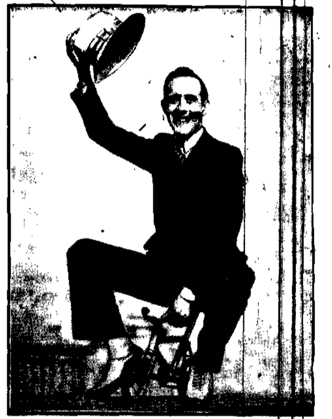
Amerikanin Repito produkuje się w Los Angeles na takim manufak- turyrrowerze. Zbyt wielkich podróży, co prawda, odbywać na nim nie można.