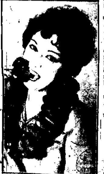
Jak widać... z Los Angeles, lub... pączki.