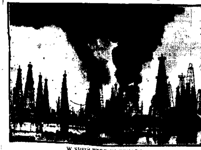
W SPELLETOP W TEXAS

Wielki pożar naftowego szybu z śmiercią 100,000 dolarów.