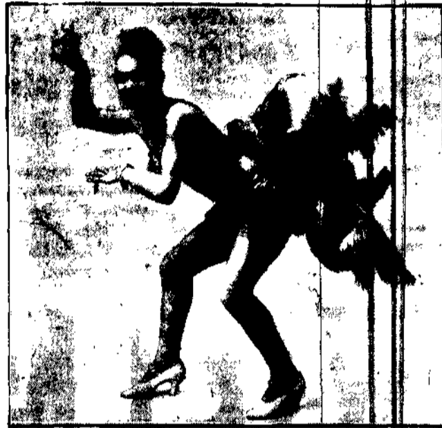
Do Paryża przybyła tancerka, oryginalna murzynka afrykańska, która swoim oryginalnym produkcjami zachwycała stolicę Francji. Jej tańce bowiem są najczystsze pierwotne, jakby naśladowane prymitywne rysunki ludzi dzikich. Josefina Baker naśladowuje w rytmicznych formach ruchy dzikich zwierząt. W tym stylu właśnie wykonuje ona „tańce strusia”.