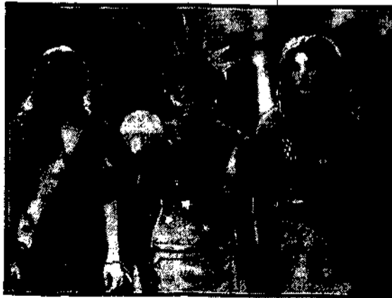
W nowym obrzydnie Poznania trzy piękne aktorki symbolizują Francję, Amerykę i Anglię.