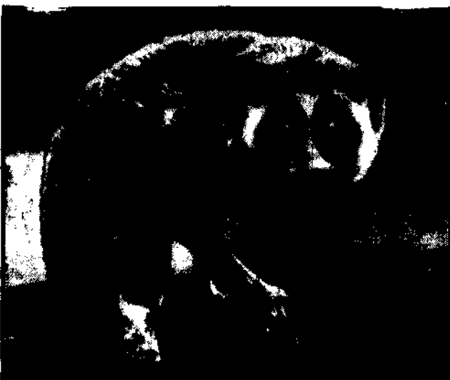
Ten dziwaczny gatunek małp żyjących przeważnie w Afryce, zamieszkuje się na Ceylu.