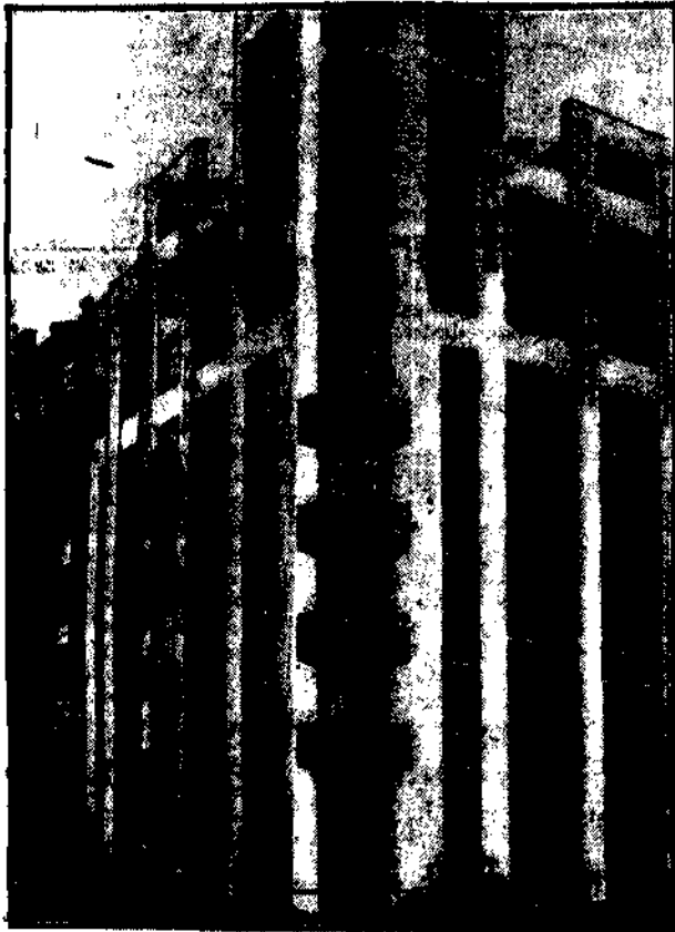
Moskiewska centrala kooperatywy wybudowała obrzymi gmach, w którym znalazły pomieszczenie biura i składy towarowe.