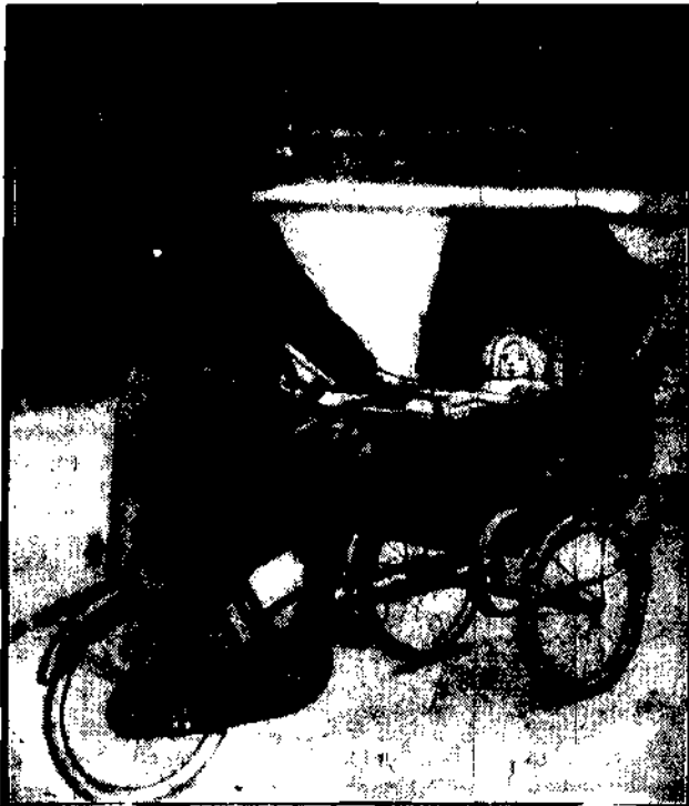
Praktyczny wynalazek małej angielskiej, która widocznie uprawia musią sport rowerowy