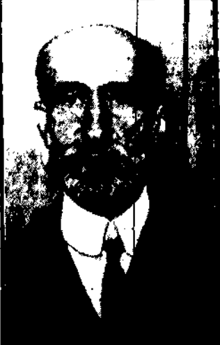
Dr. Lobjeiz z Paryża, który doświadczył z radium... w ręce został odznaczony...