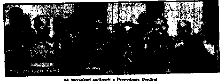
na specjalnej audyencji u Prezydenta Republiki