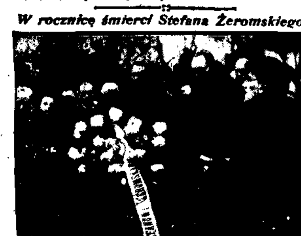
Pracownicy Klubu Literackiego przez Jan Lorentowicz i sekretarz Refektoryj... napisali...