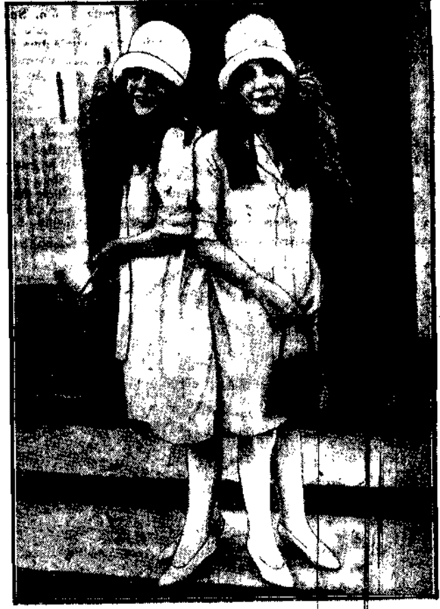
DWIE ZROŚNIETE BLIZNIACZKI zostały przyjęte w Białym Domie przez prezydenta Coolidge'a.