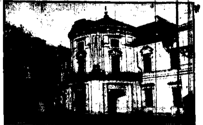
Pałac na Janusza Radziwiła w Warszawie, przy ul. Białostockiej.