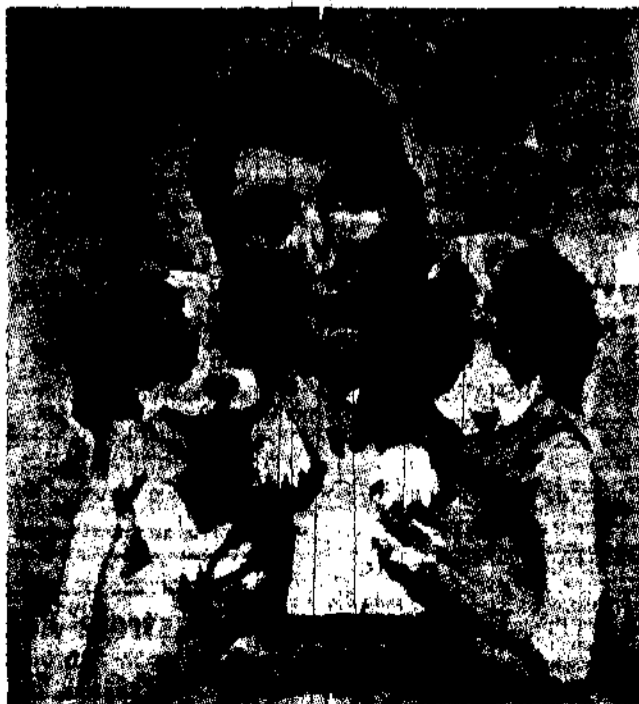
Od wieków pieśń tego śpiewa, że on wierność dochowa, że on jest wierny jedynie, Przemysły zaś białogłowa.