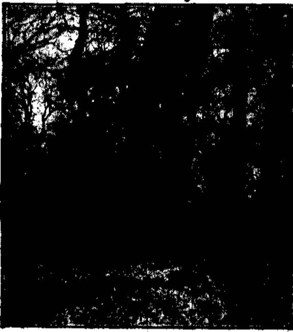
Dąb obrzym, liczący 275 lat w parku białostockim pod Warszawą.