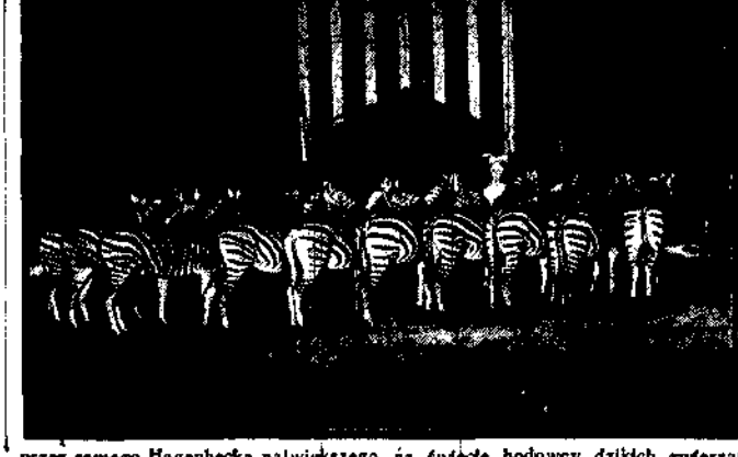
przez samozę Magenbocka największego na świecie hodowcy dzikich zwierząt