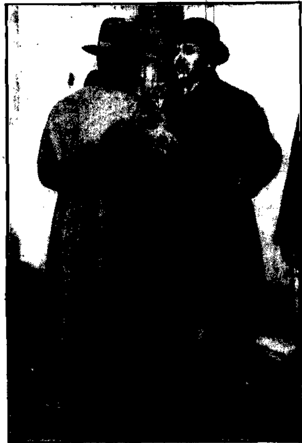
Wicepremier Bartel: — Trudno panie posle, niemożę!!!