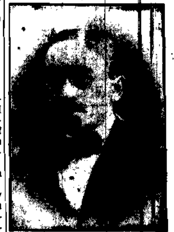
Posel Aleksander Zwirzyński