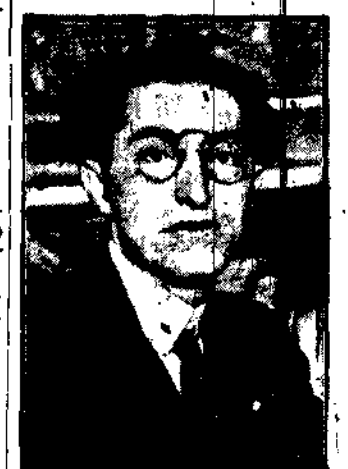
tużecki minister spraw zagranicznych, który przed paru dniami odbył konferencję w Odesie z Czernomirskim